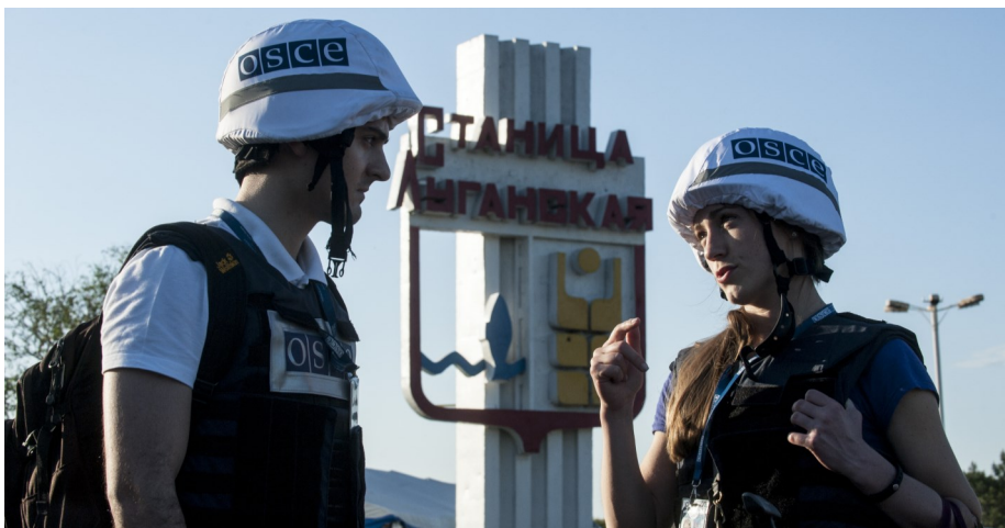
Представники СММ ОБСЄ у Станції Луганській, Луганська область, травень 2016 р.