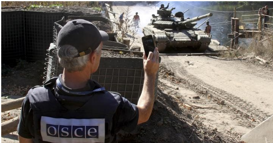
СММ ОБСЄ моніторить відведення танків у Луганській області, 5 жовтня 2015.