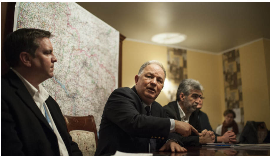
Голова Місії Ертуруль Апакан відвідав Краматорськ та Северодонецьк