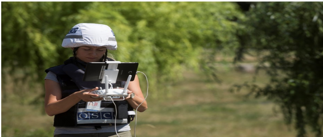
Співробітниця Місії керує польотом БПЛА в Донецькій області