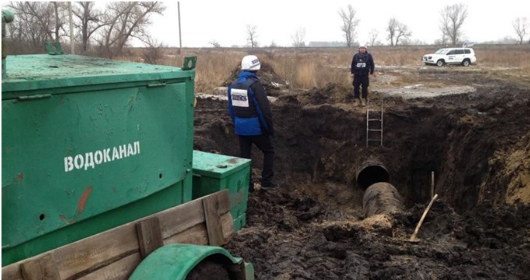
Спостерігачі СММ здійснюють моніторинг проведення ремонтних робіт на водогоні на сході України