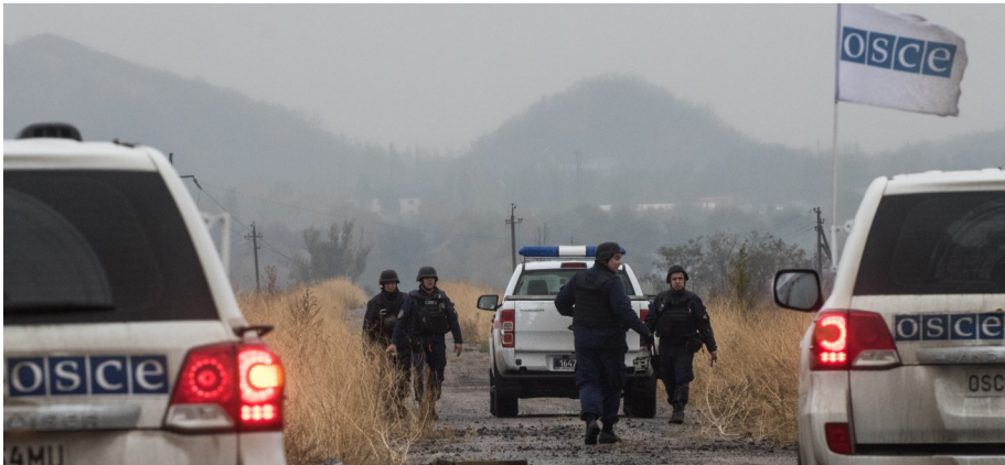
СММ ОБСЄ сприяє встановленню локального режиму припинення вогню та здійснює моніторинг його дотримання, що дало можливість виконати роботи з розмінування в районі газорозподільної станції поблизу Мар'їнки.