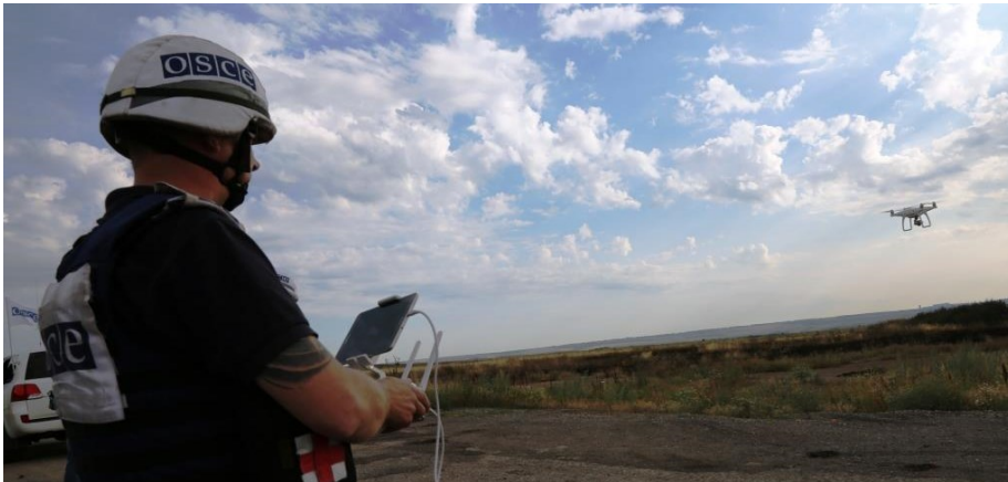
Спостерігач СММ ОБСЄ керує безпілотним літальним міні-апаратом поблизу Дебальцевого, Донецька область.