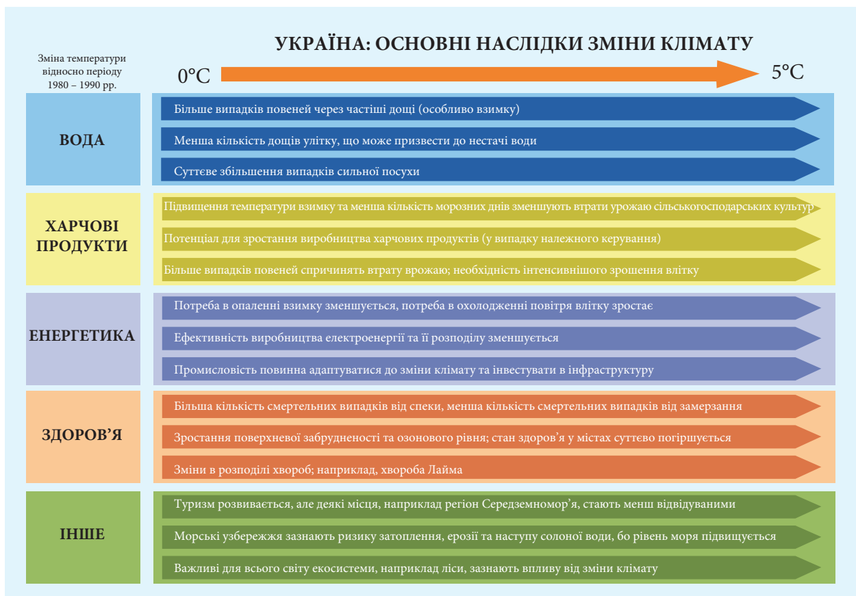
Мал. 2.1. Огляд основних наслідків зміни клімату для України.

Тоді як захворюваність і смертність (у зв'язку з холодом) зменшуватимуться через теплі зими, загалом здоров'я людини може