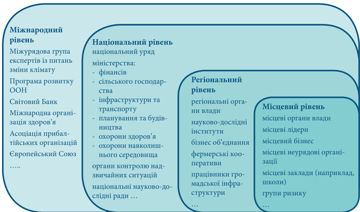
Мал. 3.2. Візуальна мапа інститутів і зацікавлених сторін, залучених до процесу адаптації (Джерело: Hilpert et al. 2007/адаптовано: Lim, Spanger-Siegfried 2005).