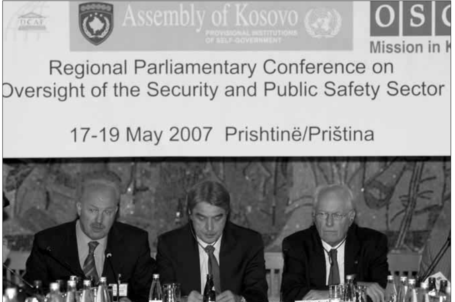
Güvenlik Komisyonu Başkanı Sn. Maloku, OMİK Şefi Ambassador Wnendt ve DCAF temsilcisi, Sn. Wim van Eakelen, Grand Otelde düzenlenen açılış toplantısında

Kosova ilk defa olarak böyle geniş katımlı bir yöresel konferansa ev sahipliği yaptı ve katılımcıların değerlendirmesine göre bu son toplantı olmayacaktır.