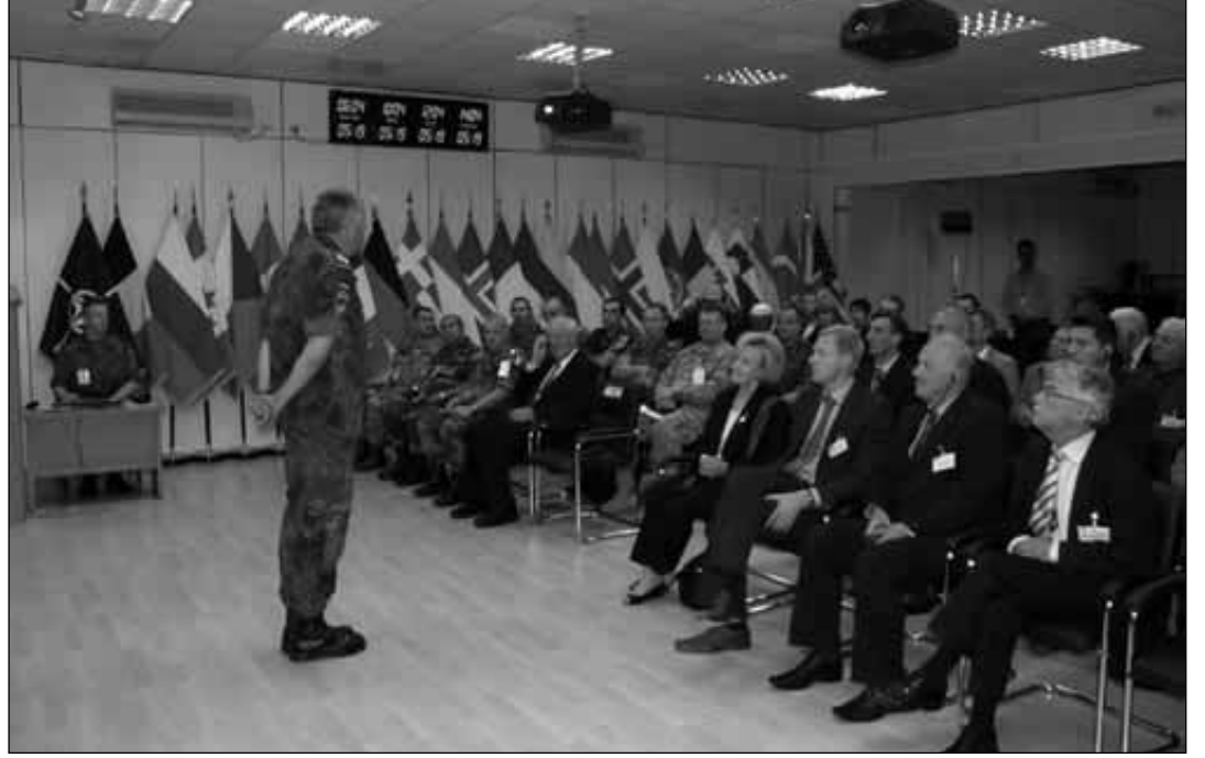
KFOR Komutanı General Kather, Film Sitideki katılımcılara brifing sunarken

'Parlamento Denetimi ve Kamu Güvenlik Sektörüne değin Yöresel Konferans' AGİT Misyonu ile Kosova Meclisi tarafından ortaklaşa olarak tertiplenen üçüncü yöresel geniş konferansı oluşturmaktadır. Önceki konferanslarda Bütçe denetimi (2005) ve Polis denetimi (2006) konuları ele alınmıştı. Bu Konferans Eylül 2006