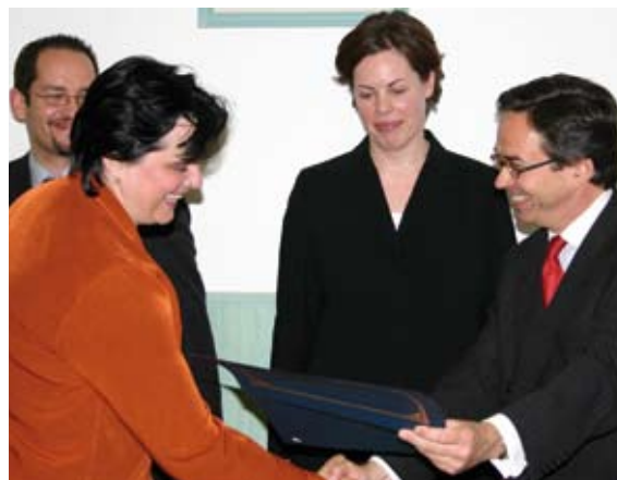
Direktor ODIHR-a Ambasador Christian Strohal pruža diplomu mađarskom policijskom službeniku koja je uspešno završila trening program za suzbijanje zločina iz mržnje, sponzorisanog od strane ODIHR-a, u Budimpešti, 5. maja 2005. godine.