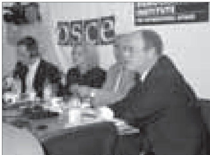
Pres konferencija o izdavanju Priručnika o javnim saslušanjima od 26. maja

5. Nedovoljan broj dobro obučanih radnika za pravnu pomoć i dalje predstavlja veliki