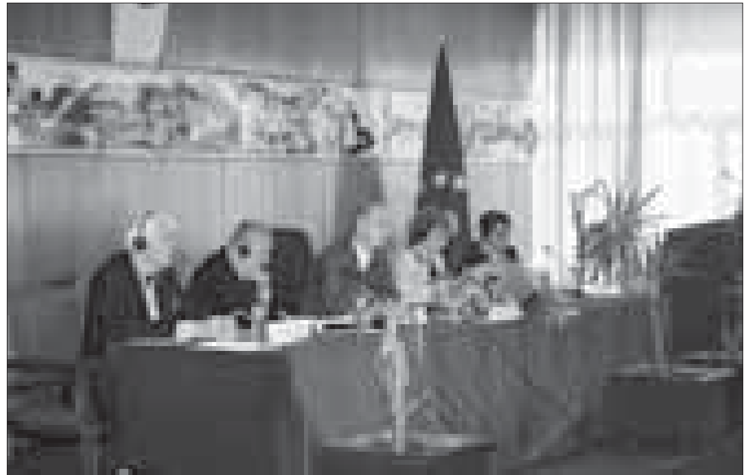
EAR Forum od 24. juna 2004. godine