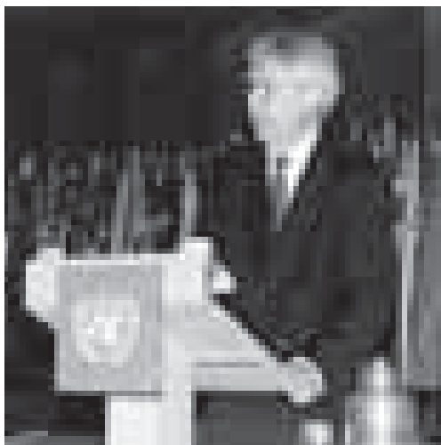
Novoimenovani SPGS Søren Jessen-Petersen

Kako se približava sredina avgusta, kosovska pitanja će početi da oduzimaju sve više