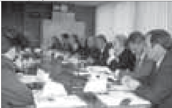
Politički savetnici u radionici 3. juna

“Saradnja između vlade i Skupštine” je bila tema radionice za političke savetnike ministarstava, koju su 3. juna organizovali OEBS, Nacionalni demokratski institut (NDI) i Fondacija Fridrih Ebert (Friedrich-Ebert Stiftung). Ova radionica je deo u nizu radionica ponuđenih savetnicima u maju i junu 2004.