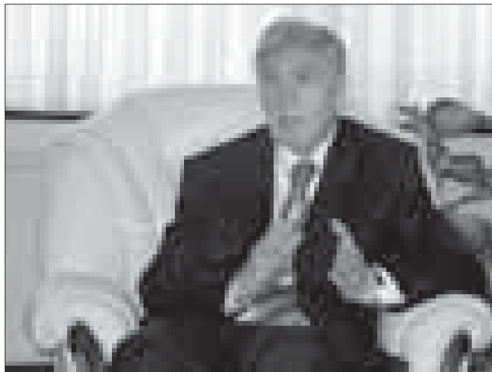
Prof. Nedžad Daci, predsednik kosovske Skupštine

Mislim da se SPGS Holkeri puno trudio. Bio je pošten čovek. Ja sam kod njega video veoma ozbiljnog političara, ali je UNMIK struktuiran na način koji ne može postići uspeh. Ja