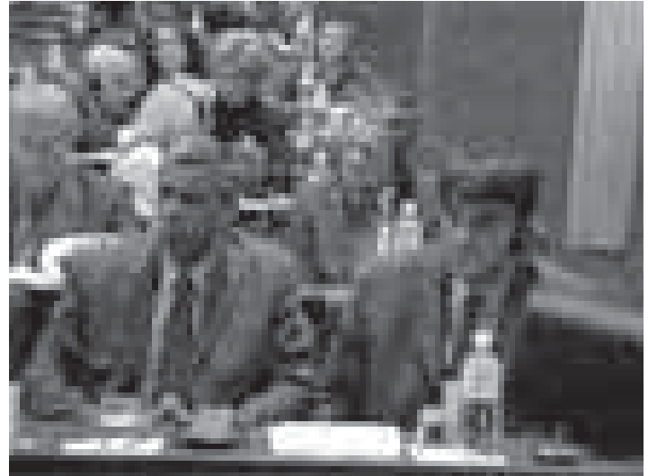
Članovi Skupštine iz koalicije Povratak na plenarnoj sednici septembra 2003.

Nezadovoljstvo kosovskih Srba predstavnika PIS je dostiglo kulminaciju u februaru 2004., kada je trebalo da se inauguriše renovirana sala Skupštine. U renoviranom ulaznom holu istaknuti su murali koji prikazuju događaje iz albanske istorije. Nije bilo ničega što bi odražavalo srpsku ili neku drugu istoriju i tradiciju Kosova. KP je odlučila da bojkotuje zasedanja Skupštine, ali je nastavila rad u drugim telima Skupštine, uključujući komisije i radne grupe. Martovsko nasilje se dogodilo tokom ovog politički napetog perioda i kao rezultat, KP je započela potpuni bojkot svih institucija. Krhka interakcija između kosovskih Srba i PIS je izgorela zajedno sa kućama koje su gorele tokom nasilja. Štaviše, za mnoge kosovske Srbe, nasilje je bilo potvrda da se učestvovanje u kosovskim institucijama