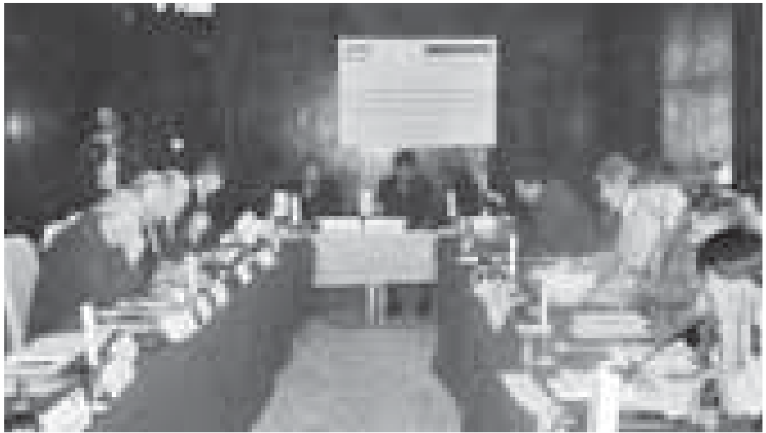
Konferencija o privrednim dešavanjima od 8. juna

Nakon uvodnog govora od strane g-dina Rajnera Vilerta (Rainer Willert), koordinatora Fondacije za jugoistočnu Evropu, započela je vrlo živa i kontroverzna razmena mišljenja. Učesnici su se složili da je makroekonomska situacija na Kosovu na zadovoljavajućem nivou. Budžet se smatra realnim, s obzirom da se budžet za 2003. godinu povećao za 43 miliona evra u poređenju sa prethodnom godinom. Niska stopa inflacije od oko 1% ne ugrožava ekonomski razvoj, dok je spoljni trgovinski deficit identifikovan kao ozbiljan problem. Izvoz pokriva samo 4% uvoza i ta razlika se mora finansirati transferom inostranog kapitala preko međunarodnih organizacija