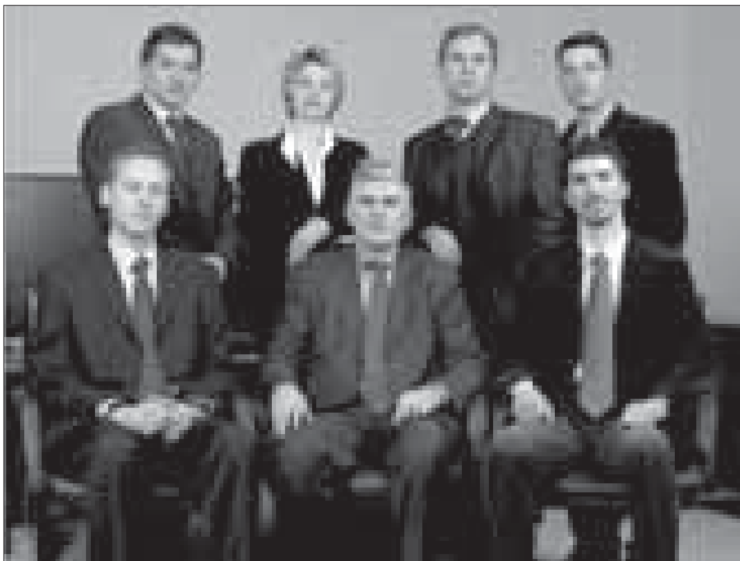
Kosovski premijer Bajram Redžepi i njegovi savetnici

Nema sumnje da sve institucije uče i da ima mnogo toga što se može popraviti. Ja mislim da su lični odnosi odlični i da funkcionišu vrlo