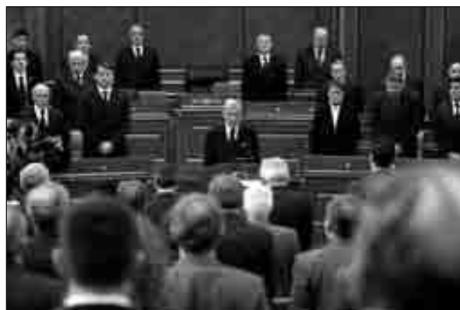
Seanca komemorative e Kuvendit të Kosovës me rastin e vdekjes së Presidentit Rugova me 22 janar.