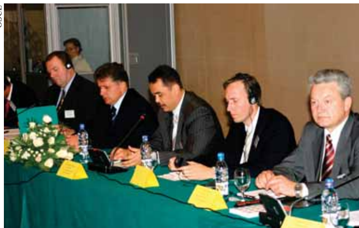
Семинар послужил основой для обсуждения вопросов, связанных с введением и организацией финансового мониторинга в странах Центральной Азии

Отдел финансовой разведки – это специальный отдел, который будет заниматься сбором и анализом информации о подозрительных транзакциях и сотрудничать с правоохранительными органами Узбекистана и других стран с целью укрепления всемирной борьбы с отмыванием денег и финансированием терроризма.