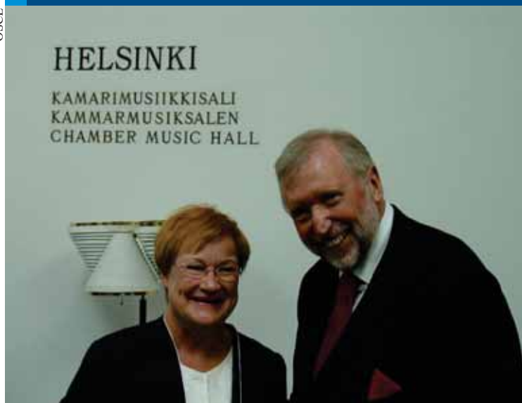
Действующий председатель ОБСЕ Дмитрий Рупел и Президент Тарья Халонен во дворце «Финляндия»