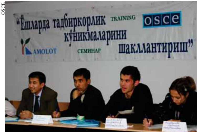
Участники ознакомились с действующим законодательством в области частного бизнеса, вопросами налогообложения, разработкой бизнес-плана и финансовым менеджментом, а также маркетингом.

Центр в Ташкенте провел тренинг II-стадии для молодых потенциальных предпринимателей из Джизакской, Сырдарьинской и Ташкентской областях, а также из города Ташкент, в рамках проекта «Формирование предпринимательских навыков среди молодежи», осуществляемого совместно с