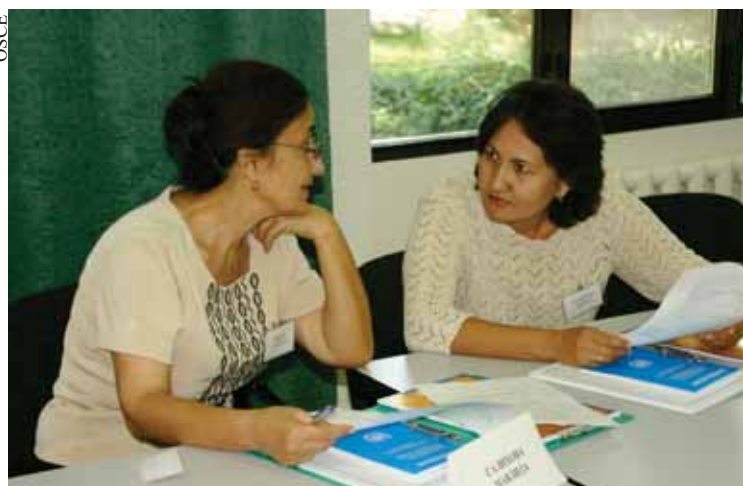
Целью курса была подготовка национальных экспертов, которые способны обеспечить объективную оценку и внести вклад в подготовку отчетов по реализации CEDAW в Узбекистане.