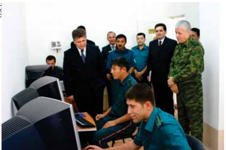
Посол Мирослав Енча, Глава Центра ОБСЕ в Ташкенте посетил новый ресурсный отдел

30 сентября Центр ОБСЕ в Ташкенте открыл Ресурсный отдел при Учебном центре Главного управления исполнения наказаний Министерства внутренних дел Республики Узбекистан.