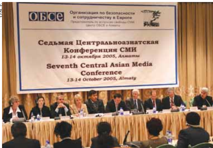
150 участников из всех пяти стран Центральной Азии обсуждают процессы развития в области СМИ в регионе.