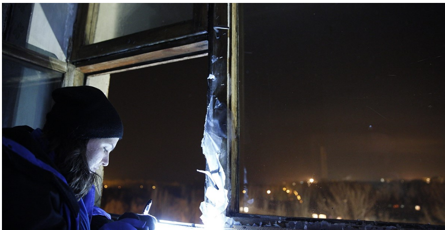
Наблюдатель СММ ОБСЕ осуществляет наблюдение в ночное время, слушая и фиксируя нарушения режима прекращения огня в Горловке, восточная Украина, 18 ноября 2016 года.