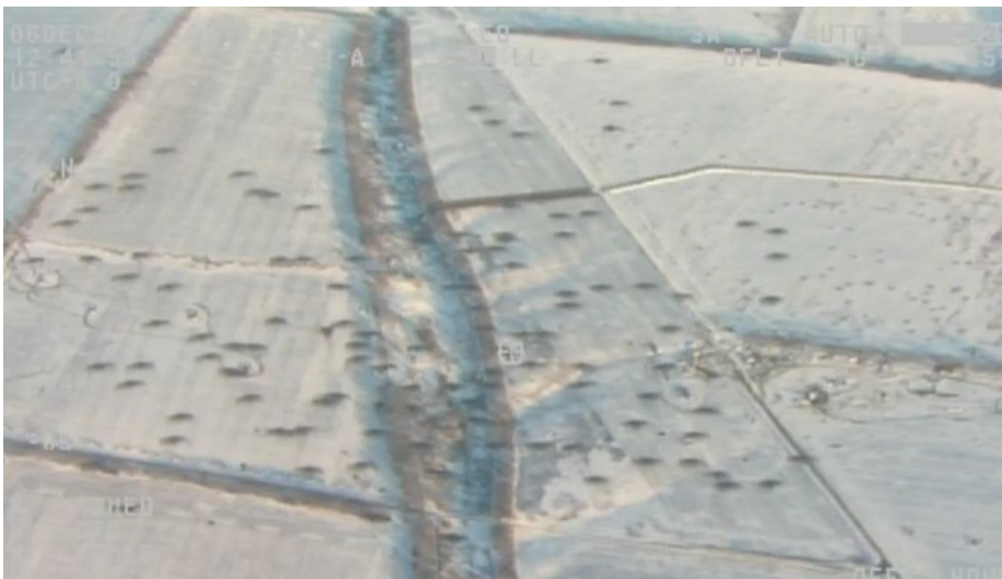
Пример фотографии с беспилотного летательного аппарата (БПЛА) СММ. Обстрел блокпоста около Мариуполя, декабрь 2014.