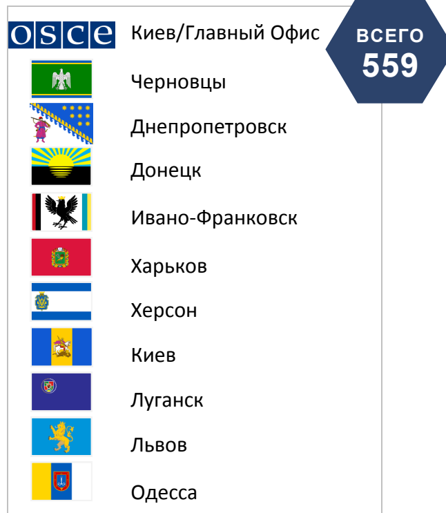
Наблюдатели СММ находятся в десяти городах Украины. Главный офис — в Киеве.