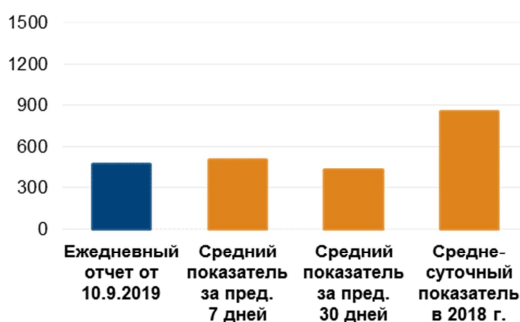
Количество зафиксированных нарушений режима прекращения огня 2