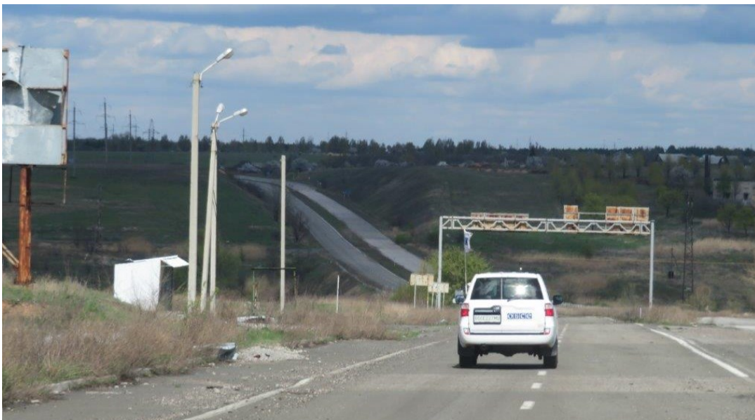
Патрулирование СММ ОБСЕ возле Ясиноватой Донецкой области, 23 апреля.