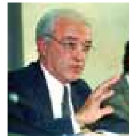
Посол Роберт Фроуик был первым руководителем Миссии ОБСЕ в Боснии и Герцеговине (декабрь 1995 – декабрь 1997 года).