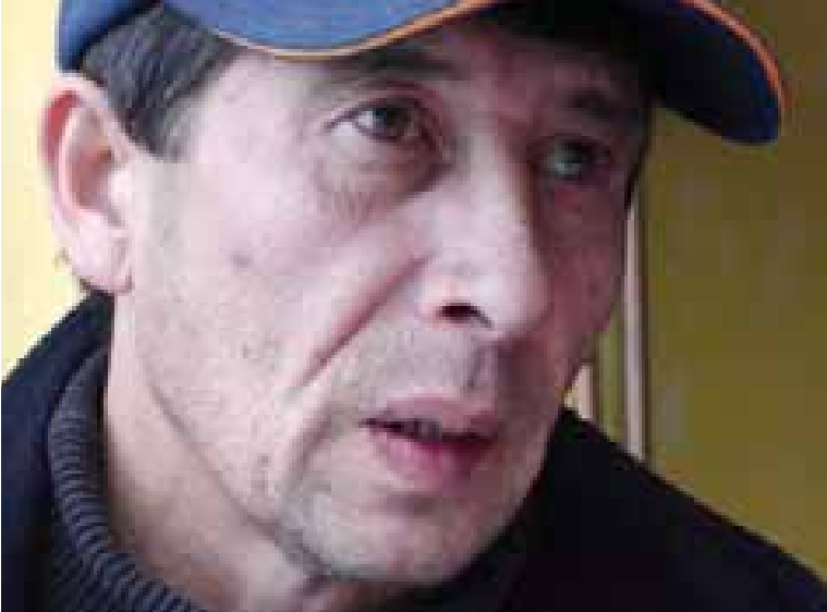
МИССИЯ В ВИДЖЕЛЕН ХАРРОФФ-ТАВЕЛ