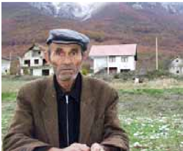
Црни-Луг, близ Босанско-Грахова на юго-западе БиГ: этот серб получил возможность вернуться назад в восстановленный дом.