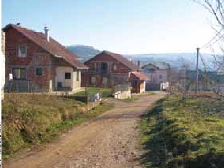
МИССИЯ В ВИГРАДЦИКА, ТРИКОВИЧ

К началу октября 1998 года семьи возвращенцев были готовы провести первую ночь в своих прежних домах. Радостный настрой этих людей (большинство которых, естественно, носили фамилию Алисич), разделявший боснийским вице-мэром Приедора и сотрудниками международных организаций по оказанию помощи, вселяя надежду на то, что это только начало.