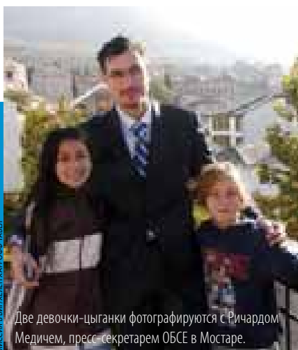
МИССИЯ В ВИДЖЕЛЕН ХАРРОФФ-ТАВЕЛ