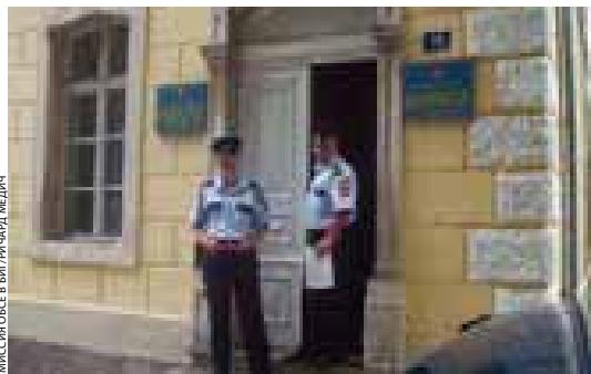
Полиция Требине: на службе жителей.

в начале 2004 года радиостанцией в Требине, выявил, что вопросы охраны порядка и безопасности находятся в списке первоочередных приоритетов местных жителей. Город Требине с населением 40 000 человек граничит с Хорватией и Черногорией.