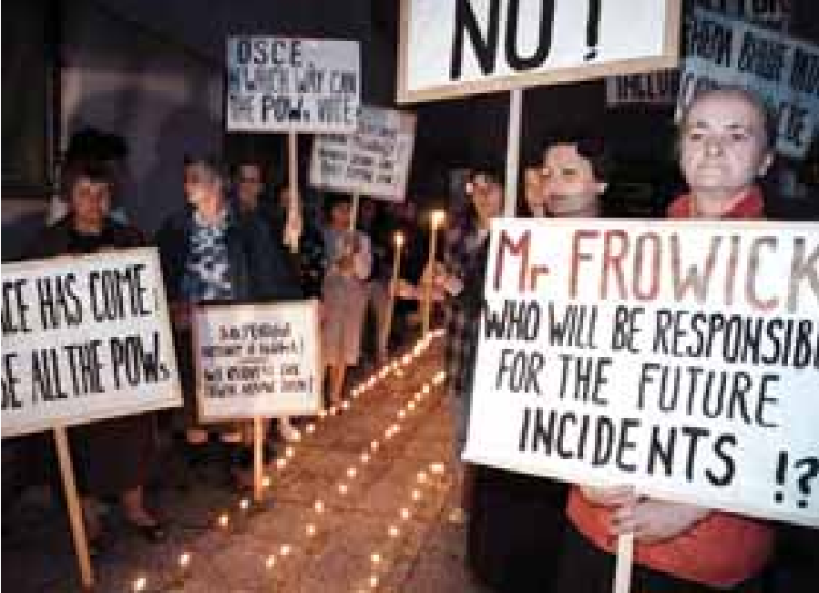
Баня-Лука, июнь 1996 года. Сербские женщины в Боснии требуют известий о своих пропавших родственниках.

нему шесть региональных центров и 25 местных отделений.