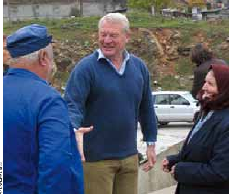
УИП МОСТАРА, А. БЕРКИЧ

Сейчас, когда идут широкие публичные дискуссии относительно процесса ССА и одновременно бурные дебаты о необходимости конституционной реформы, самое время подумать над дальнейшей ролью международного сообщества в БиГ. Было бы справедливым сказать, что без самоотверженности и участия международного сообщества, БиГ не смогла бы продвинуться так далеко и так быстро.