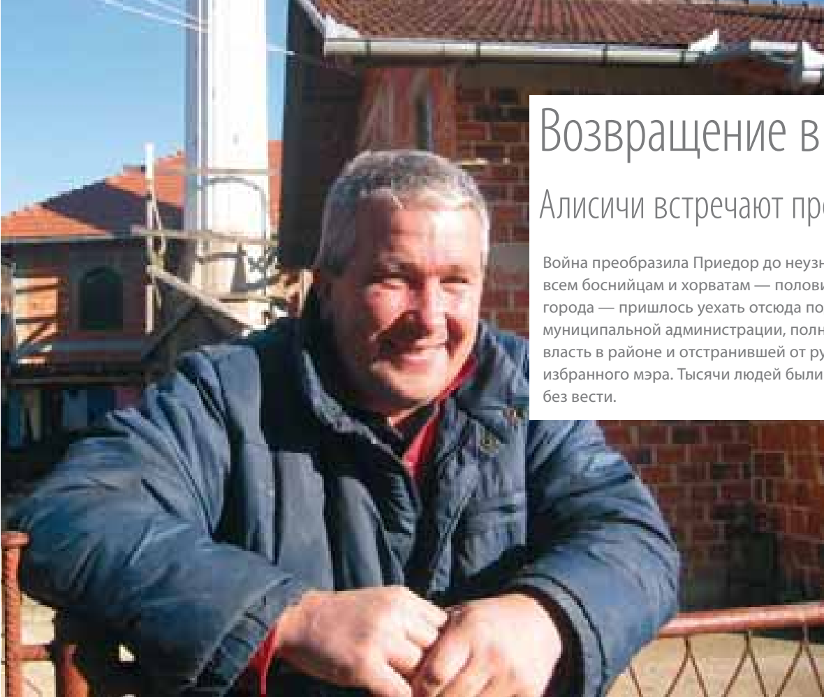
МИССИВ В ВИГРАДИЦА ГРАБОВИЧ