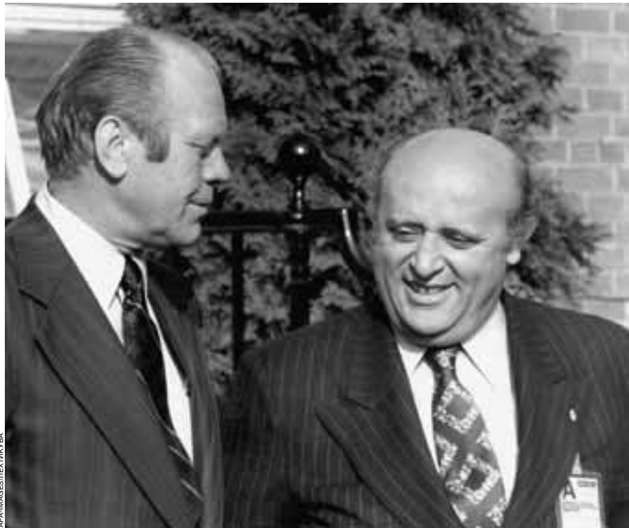
В дни Хельсинки: Сулейман Демирель обсуждает турецко-американские отношения с Джеральдом Фордом.

Встреча в Хельсинки была итогом Совещания по безопасности и сотрудничеству в Европе, сокращенно именовавшегося СБСЕ. Речь на нем шла об укреплении доверия и снижении напряженности по обе стороны «железного занавеса». Но главное оказалось в том, что согласованные там положения о правах человека стали исподволь подбадривать диссидентов в странах Восточной