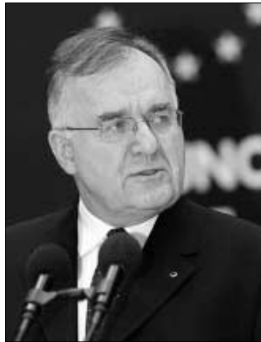
Генеральный секретарь Совета Европы Вальтер Швиммер.

ОБСЕ в регионе, особенно между двумя миссиями в СРЮ. «Мы твердо убеждены, что проблемы, касающиеся беженцев, внутренне перемещенных лиц, лиц, пропавших без вести, прав меньшинств и борьбы с организованной преступностью, носят региональный характер и могут решаться только на региональном уровне, – отметил Г. Свиланович. – Не выдвигая излишне амбициозных задач, странам региона следует сосредоточить усилия в таких областях, как развитие свободной торговли, энергетики, транспорта и телекоммуникаций, а также ликвидация организованной преступности».