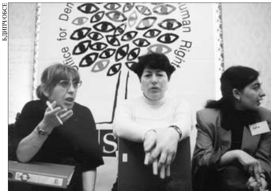
В Грузии примерно 1500 женщин смогли воспользоваться программой БДИПЧ по подготовке лидеров.

конодательства, гарантирующих эти права, и обеспечении свободного доступа к юридической помощи. Наряду с этим БДИПЧ занимается анализом законопроектов, призванных устранить практику дискриминации женщин.