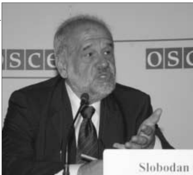
Министр иностранных дел Слободан Чашуле: выборы знаменуют собой начало новой эпохи.

мешенных лиц, а также восстановление нормальных условий жизни», – сказал он.