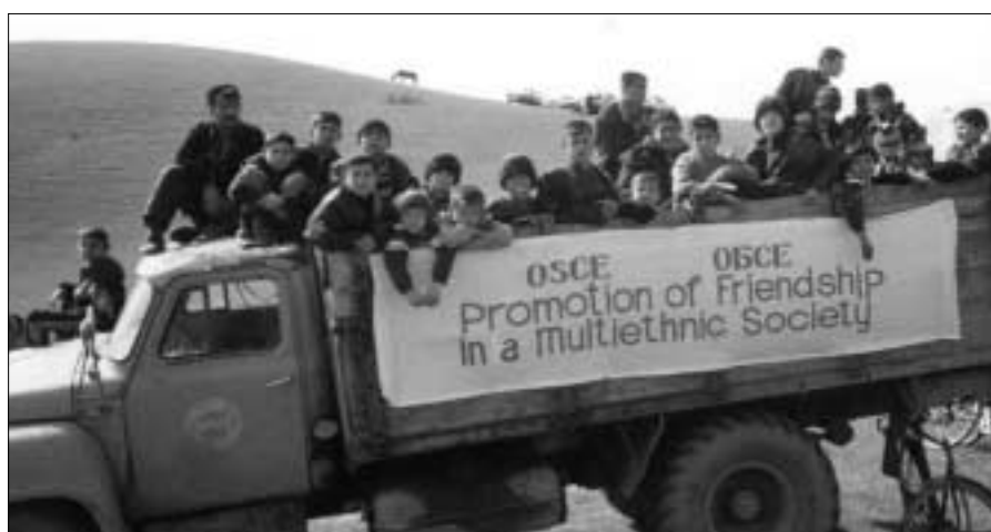
Миссия ОБСЕ в Таджикистане

Для некоторых стран с менее развитой демократией ведущаяся Соединенными Штатами «война с террориз-