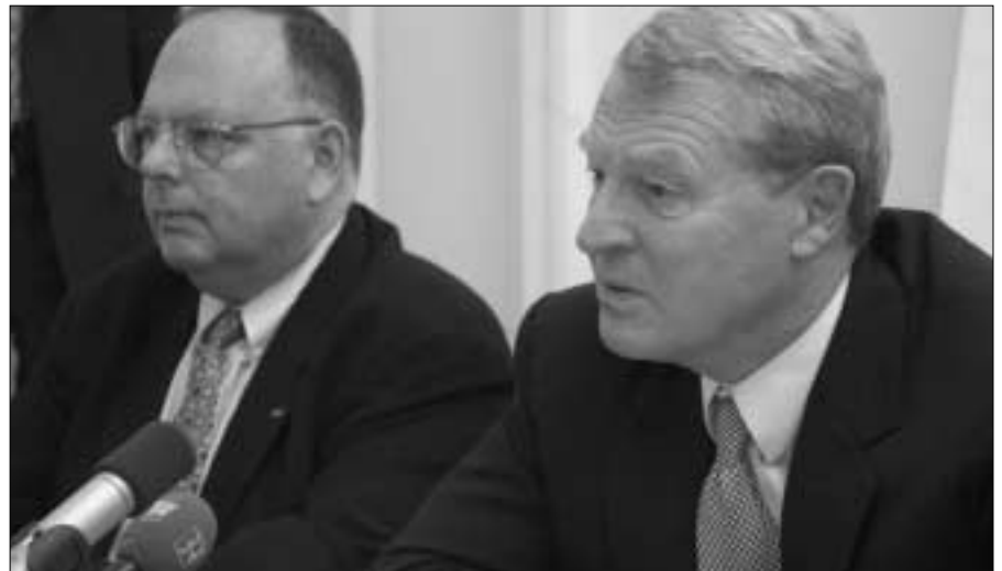
Лорд Эшдаун (справа) и посол Роберт Бикрофт рассказывают аккредитованным в Австрии представителям международной прессы о последних событиях в Боснии и Герцеговине.

По словам руководителя Миссии ОБСЕ в БиГ Роберта Бикрофта, поддержка молодежи является одной из главных целей работы в этой стране, и Миссия прилагает активные усилия к тому, чтобы голос молодого поколения был услышан. Первоочередное значение, на его взгляд, по-прежнему имеет передача гражданам Боснии и Герцеговины той ответственности, которую несут сегодня международные организации. «Тем не менее, – заявил он, – достигнутые на сегодняшний день результаты по-прежнему не прочны и не окончательны. Многое будет зависеть от того, как проголосуют избиратели 5 октября [в ходе всеобщих выборов]».