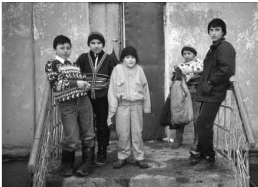
Дети вернувшихся крымских татар у входа в восстановленное здание школы под Симферополем.

В июне Верховный комиссар предпринял усилия по ускорению урегули-