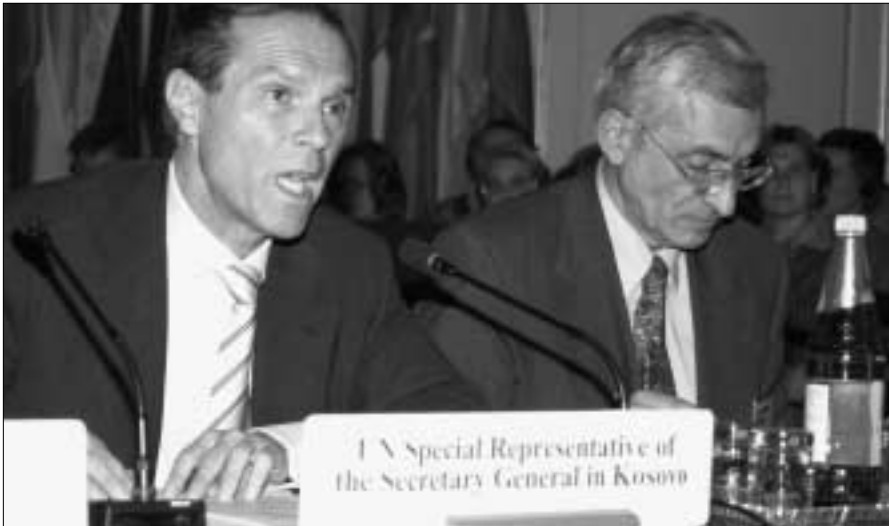
Специальный представитель ООН Михель Штайнер и руководитель Миссии ОБСЕ в Косово Паскаль Фьеши выступают перед делегациями государств-участников.

зал он, – то это верховенство закона: от него зависит все остальное».