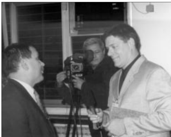
Журналист из Хорватии проводит учебное интервью с начальником тюрьмы в ходе семинара-практикума для сотрудников пенитенциарных учреждений

Проекты в области тюремной реформы БДИПЧ осуществляет в ряде стран ОБСЕ. Один из регионов, которым оно уделяет при этом особое внимание – Юго-Восточная Ев-