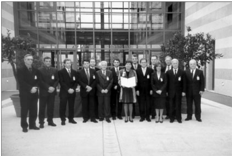
Министры стран – участниц Пакта о стабильности после подписания «Декларация о борьбе с торговлей людьми»

правоохранительных органов и осуществления уголовного преследования торговцев людьми. Министры также подчеркнули необходимость активизации соответствующей общественно-информационной кампании и программ профессиональной подготовки сотрудников пограничной службы, полиции, судей, прокуроров и консульских работников.