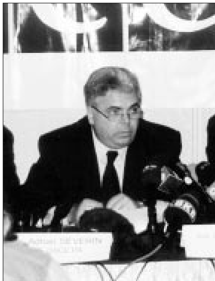
Председатель ПА А. Северин выступает с предварительным заявлением по итогам выборов в Сербии