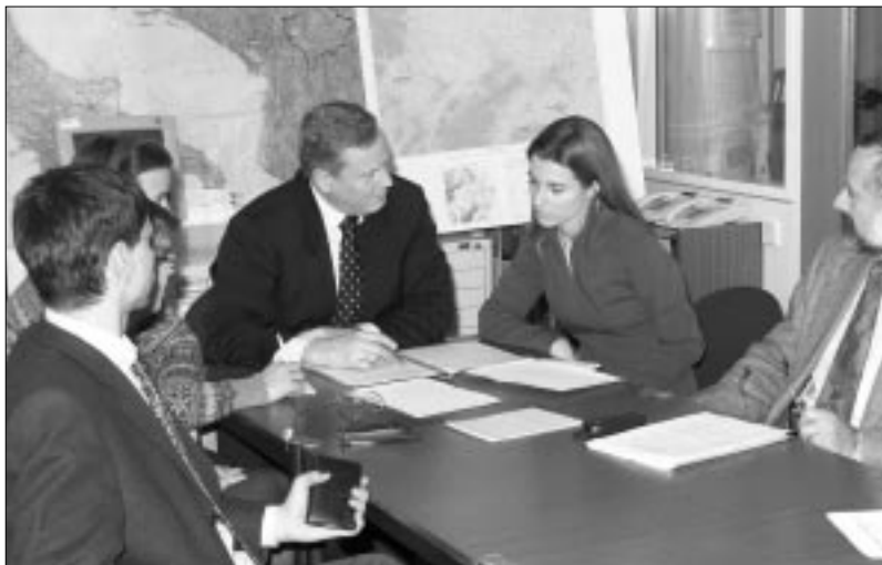
Утренний брифинг в Ситуационном центре ЦПК

«Наша группа – это инструмент, который позволяет ОБСЕ поддерживать более прямые и регулярные контакты с международными орга-