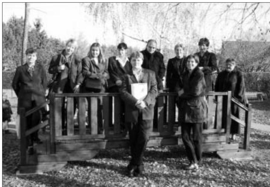
OSCE/MISSION TO ESTONIA

Хотя за последние годы в Эстонии уже проделана немалая работа в этом направлении, большинство педагогов отдает себе отчет в том, что соответствующие практические меры и методология нуждаются в дальнейшей проработке. Поездка была призвана содействовать решению этой задачи за счет изучения