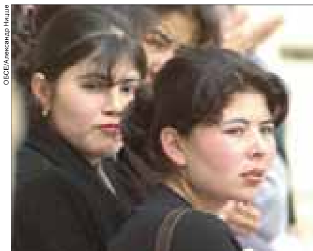
Женщины играют ключевую роль в предотвращении конфликтов и налаживании мирной жизни.

Стремясь превратить учет гендерной проблематики в непрерывный, долговременный процесс, старший советник разработала для