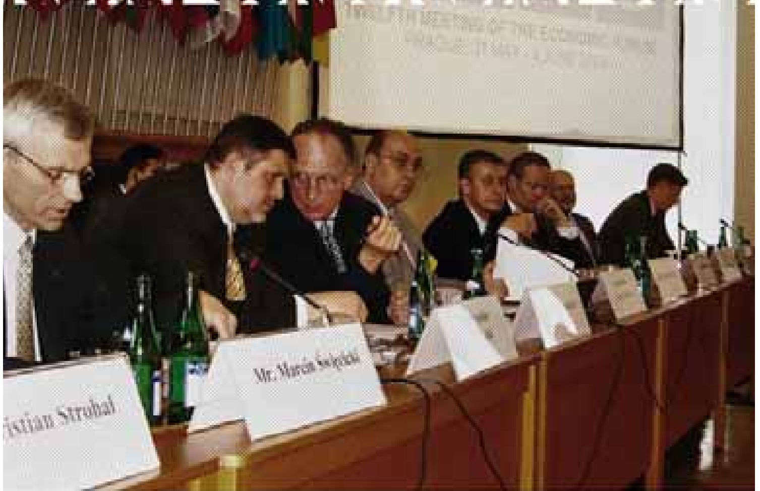
Деятельность Секретариата | Партнерские связи в интересах безопасности и сотрудничества