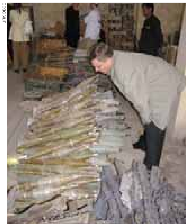
Осмотр излишков боеприпасов в ходе оценочной поездки в Таджикистан.

В порядке поддержки деятельности ФСБ, касающейся легкого и стрелкового оружия, группа обеспечения деятельности ФСБ провела всеобъемлющий обзор мер по уничтожению, экспорту и импорту такого оружия всех категорий в регионе ОБСЕ. Продолжая начатый в 2003 году проект, группа опубликовала „Справочник по лучшей практике в области легкого и стрелкового оружия“ на всех шести рабочих языках ОБСЕ. Широкое распространение включенной в Справочник информации было обеспечено с помощью двух региональных семинаров – в Ашхабаде в мае и в Скопье в июле. Представители группы возглавили делегацию экспертов, оценочные поездки которой в Беларусь и Таджикистан стали первыми конкретными шагами по повышению безопасности запасов и уничтожению излишков