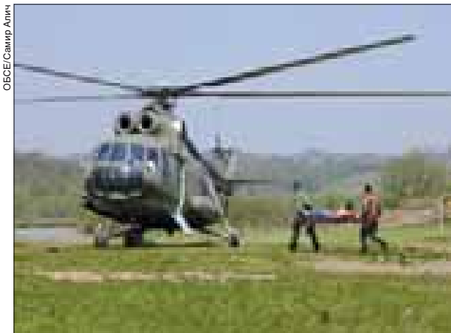
Военные подразделения из обоих входящих в состав Боснии и Герцеговины образований приняли участие в учениях по отработке действий в случае стихийного бедствия, за которыми наблюдал личный представитель Действующего председателя по статьям II и IV.

Делая гигантский шаг в процессе нормализации обстановки в регионе, стороны Соглашения о мерах укрепления доверия и безопасности (МДБ) в Боснии и Герцеговине приняли 28 сентября решение прекратить действие положений статьи II Приложения 1-В к Дейтонским мирным договоренностям. В своем решении они отметили огромный прогресс, достигнутый в реализации режима МДБ, и приняли во внимание выполнение Закона об обороне Боснии и Герцеговины (БиГ), благодаря чему было создано единое оборонное ведомство. Прекращение действия Соглашения не мешает любым из сторон в добровольном порядке договориться о продолжении применения любых из мер, предусматривавшихся ранее Соглашением или связанных с ним.