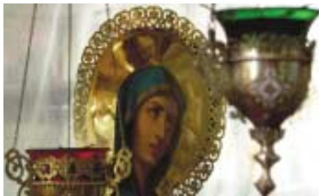
Богатое религиозное и культурное наследие Казахстана глазами фотографа Любомира Котека.

судебных и пенитенциарных органов в том, что касается прекращения нарушений прав человека. Их не особо интересуют сложность и издержки осуществления эффективной правовой реформы, и они исходят из того, что государство способно финансировать эту реформу и претворить ее в жизнь.