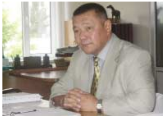
Генерал-майор милиции Кенешбек Дуйшенбаев.

Поскольку успех нашей работы в значительной мере зависит от восприятия общественностью восьми предусмотренных программой проектов, мы вместе с ОБСЕ стараемся информировать население и СМИ об этой программе. Должен сказать, что отклики к нам поступают весьма позитивные. Генерал-майор Кенешбек Дуйшенбаев, начальник УВД г. Бишкека