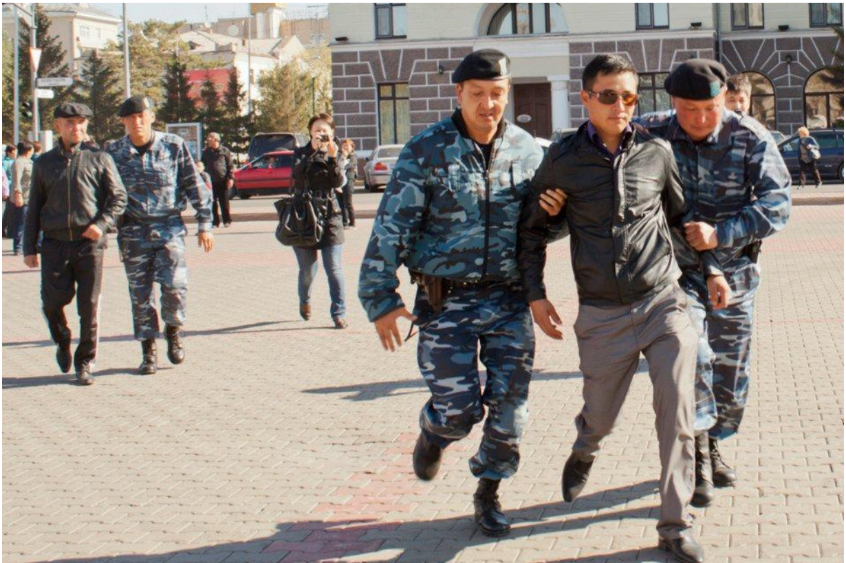
Фото 1. Наиболее часто собрания прекращались полицией.

В ходе судебных заседаний в рамках мониторинга ни в одном деле суд не исследовал вопрос - требовалось ли получение разрешения для проведения собрания или мероприятия?