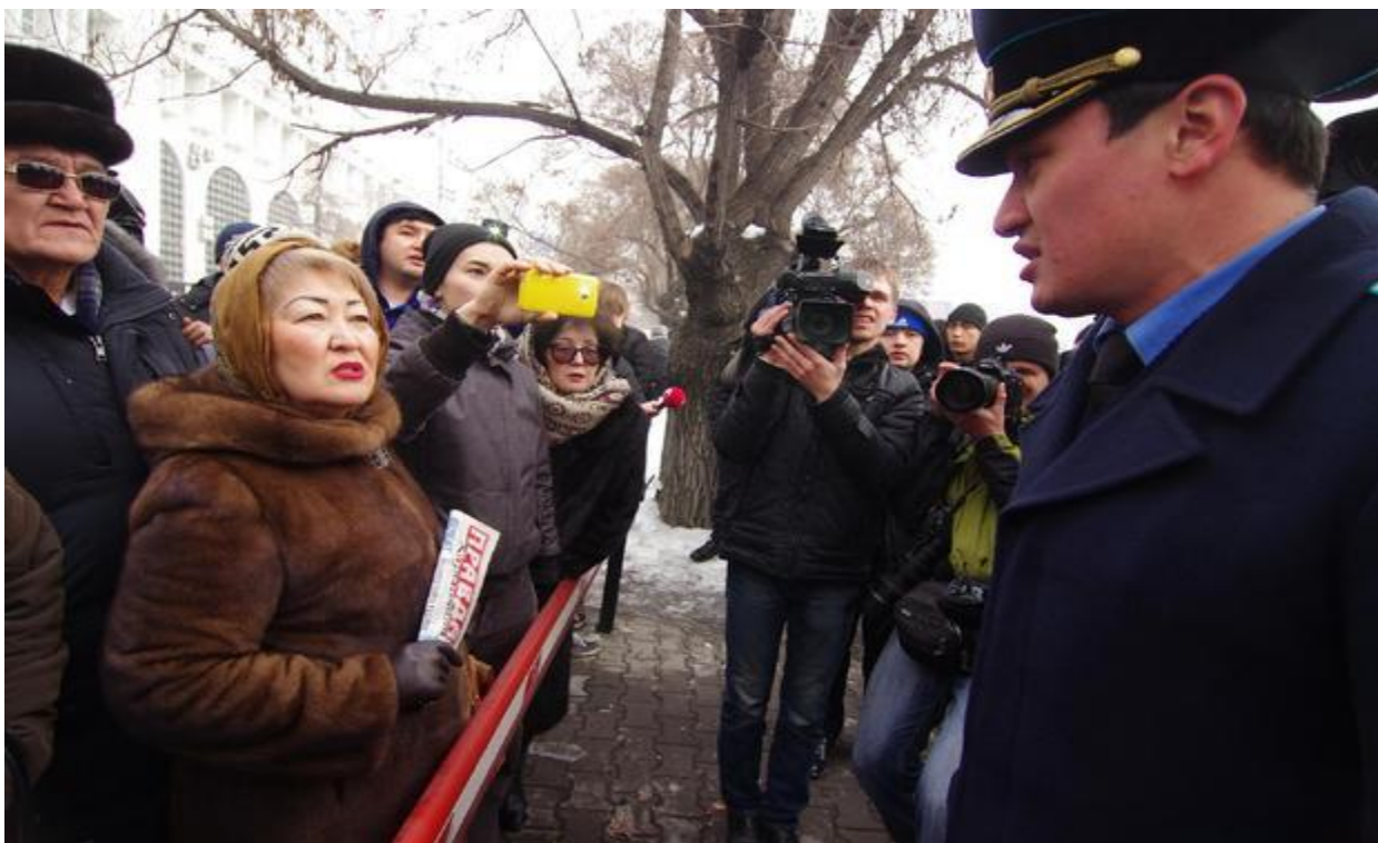
Фото 2 Прокурор сообщает о незаконности собрания

В соответствии с законом, право на прекращение незаконного собрания принадлежит представителям местных исполнительных органов. Однако, как показано в диаграмме 2, только в 22 случаях из 76 такое прекращение проводилось надлежащими субъектами. В остальных случаях процедура прекращения собрания была осуществлена субъектами, не имеющими таких полномочий, то есть незаконно.