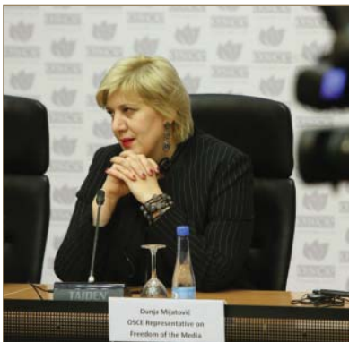
Дунья Миятович