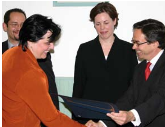
Dyktor ODIHR, ambasador Christian Strohal wręcza dyplom węgierskiej policjantce, która ukończyła sfinansowane przez ODIHR szkolenie w dziedzinie zwalczania przestępstw na tle nienawiści, 5 maja 2005 roku, Budapeszt.

Krótkiemu zarysowi historycznemu przestępstw na tle nienawiści towarzyszy dyskusja na temat różnic między terroryzmem a przestępstwami na tle nienawiści, prawnej ochrony przed przestępstwami na tle nienawiści w danym kraju, stosowania tej ochrony oraz wpływu osób propagujących nienawiść na społeczności będące jej objektem.