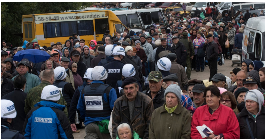
Мирні жителі чекають у черзі на контрольному пункті в'їзду-виїзду «Станція Луганська», Луганська область, вересень 2016 року.