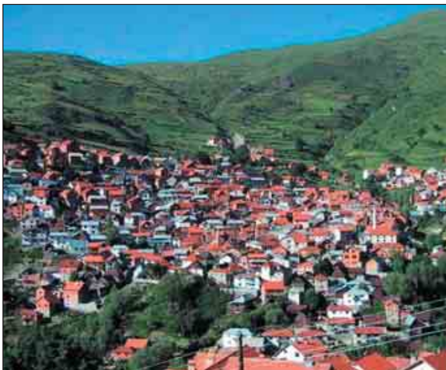
"Ideja që banorët e një qyteti, qyteze a fshati dinë më së miri se si të shqyrtojnë shqetësimet në ambientin e tyre, në Evropë është me mijëra vite e vjetër"

Në pranverën e vitit 2004, Kosova bëri hapat