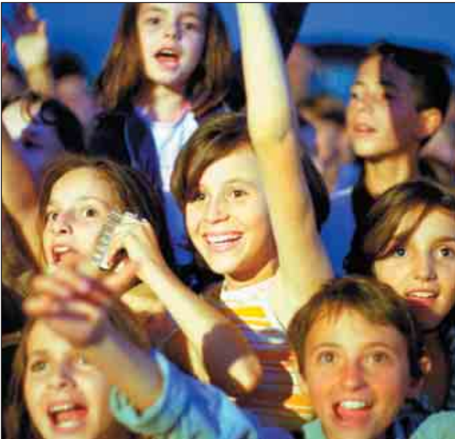
Në Kosovë, me afërsisht 2500 OJQ të regjistruara, shoqëria civile mund të luaj rol shumë të rëndësishëm në ndërtimin e proceseve demokratike

Si përfundim, pa një angazhim të plotë të shoqërisë civile, në veçanti për temat si transparenca dhe përgjegjësi, do të jetë e vështirë të plotësohen Standardet për Kosovën.