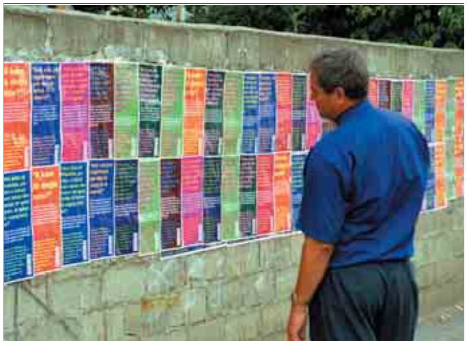
Bashkëpunimi në mes të SKQZ-së dhe OSBE-së në zgjedhjet 2004 është edhe një hap para drejt një menagjimi të qëndrueshëm dhe demokratik të zgjedhjeve në Kosovë

Tani kërkohet që çdo parti e regjistruar politike, të mbajë shënime dhe të zbulojë të gjitha kontributet që kalojnë vlerën prej 100 euro. Asnjë individ nuk guxon t'i japë më shumë se 20.000 euro një partie mbrenda një viti kalendarik. Çdo parti e regjistruar politike nuk pranon kontributin e tërthortë nepërmjet një individi nga mjetet, prona apo shërbimet e palës së tretë. Nga partia politike do të kërkohet të dorëzojë raport të hollësishëm financiar, çdo gjashtë muaj duke filluar nga një shtatori 2004. Raporti do të kërkojë nga partitë politike t'i paraqesin të gjitha ardhurat, shpenzimet, mjetet dhe detyrimet.