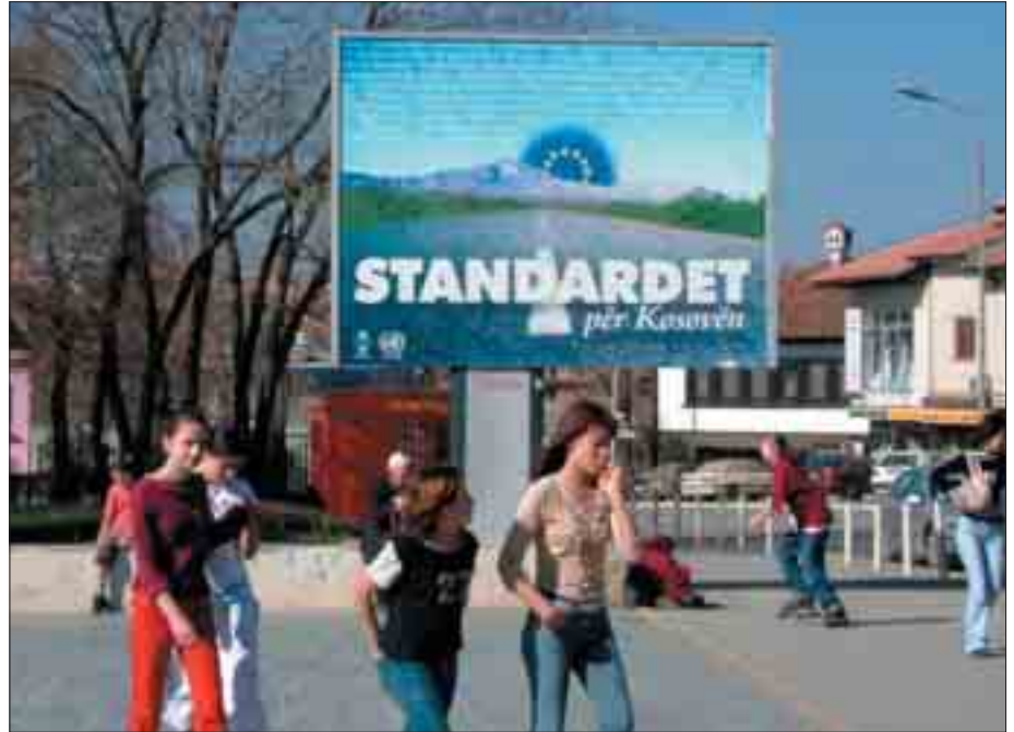
Standardet synojnë një qeveri të zgjedhur demokratike...që përfaqëson interesat e të gjitha komuniteteve të Kosovës

Nevoja për strukturat paralele duhet të re-