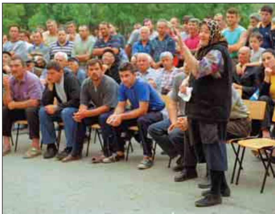
Standardet e theksojnë rëndësinë e përdorimit të lirë të gjuhëve zyrtare dhe përfaqësim të drejtë të të gjitha komuniteteve.

Anëtarët e asambleve komunale, si dhe nëpunësit civil, shpeshherë e shohin veten si përfaqësues të partive politike të tyre të udhëhequra nga politikanë të fuqishëm, e jo si mbrojtës të dëshirave dhe interesave të fqinjëve të tyre. Edhe kjo është trashëgim nga kohërat socialiste. Njeriu në rrugë shumë shpesh ndihet i injoruar kur politikanët e shohin vetveten të ngatërruar në diskutime të pafundme për karriga dhe pozita, dhe duke ia hedhur njëri tjetrit. Dhe kur diskutohen çështjet që e shqetësojnë atë, që shpeshherë ndodh në qarqe të mbyllura me dyer të mbyllura. Kjo është një pasojë e një përzierje jo të shëndoshë të trashëgimisë nga regjimi socialist në njërin anë, dhe në anën tjetër, zakonet tanimë të vjetruar të fshehtësisë.