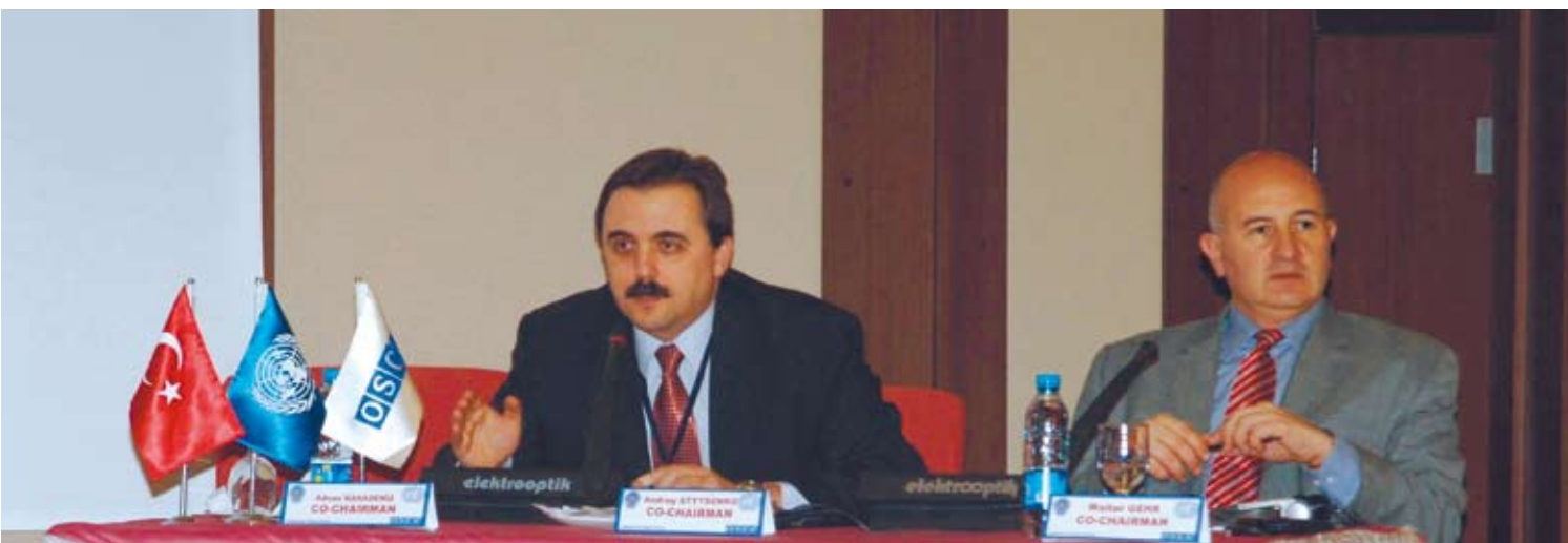
НАЦИОНАЛЬНАЯ ПОЛИЦИЯ ТУРЦИИ

И это не может не радовать ЮНОДК, которое стремится к улучшению правоприменительной деятельности и взаимной правовой помощи по каналам регионального сотрудничества. “Организованная преступность представляет серьезную угрозу для региона ОБСЕ, – говорит директор-исполнитель ЮНОДК Антонио Мария Коста. – Национальные границы не останавливают преступников, поэтому наша рука закона должна быть достаточно длинной и способной сделать сети правоохранительных структур эффективнее сетей криминальных структур”.