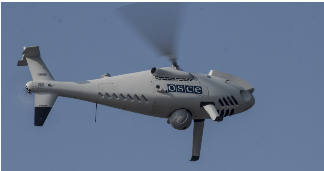
БПЛА СММ дальнего радиуса действия.