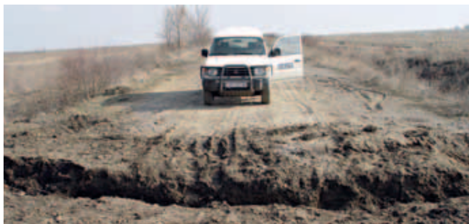
Сотрудники Миссии в Молдове регулярно патрулируют приднестровский участок молдавско-украинской границы.

Укрепление доверия и безопасности в контексте уменьшения угроз. Миссия оказывала министерству обороны финансовую и материально-техническую помощь в уничтожении излишних и просроченных артиллерийских боеприпасов.