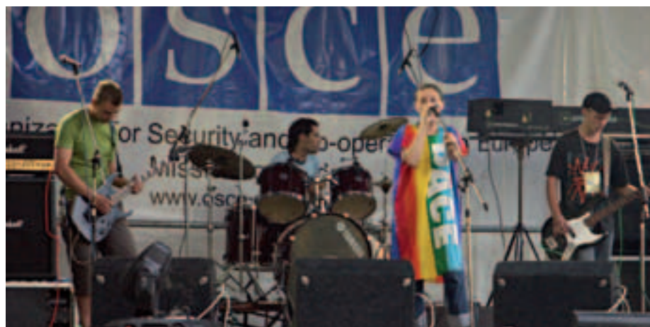
«Восстановление мостов» - под таким девизом проводился рок-фестиваль, организованный ОБСЕ 12 августа на курорте Вадул луй Водэ под Кишиневом. На фестивале выступили ВИА, прибывшие с разных берегов Днестра.

посол Луис О'Нил Пересмотренный сводный бюджет: 1 622 500 евро www.osce.org/moldova