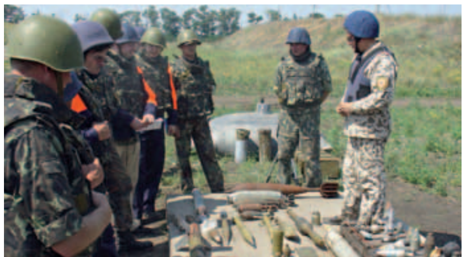
Эксперты по утилизации боеприпасов от Секретариата ОБСЕ, Европейской комиссии и вооруженных сил Германии во время совместного посещения в августе хранилища боеприпасов в Новобогдановке на предмет его оценки.

В 2006 году 50 хозяйств в южной части Одесской области, расположенной вблизи одного из наиболее известных европейских природных заповедников, занялись экотуризмом, после того