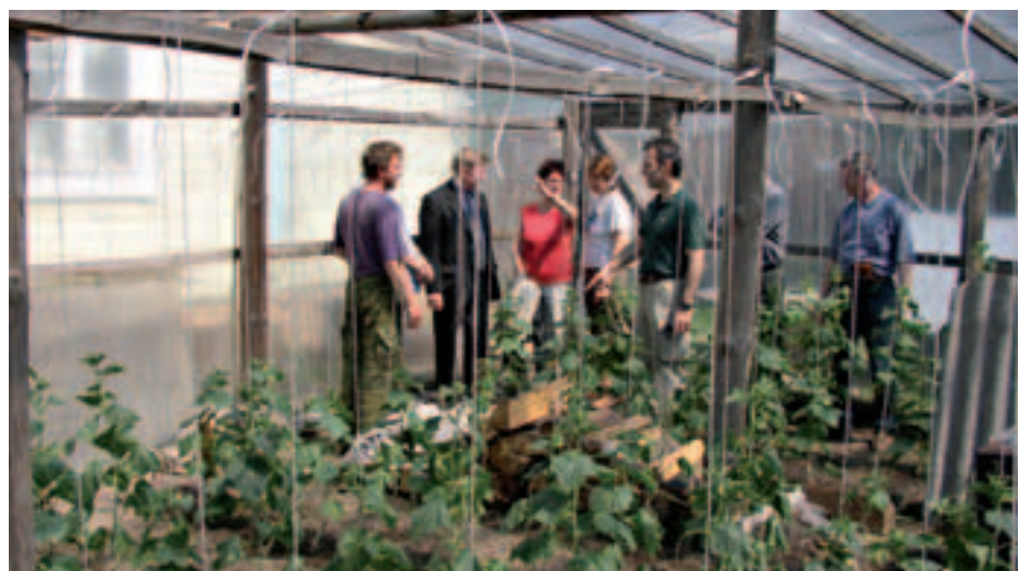
Сотрудники ОБСЕ в парнике в восточном Полесье, 15 июня.