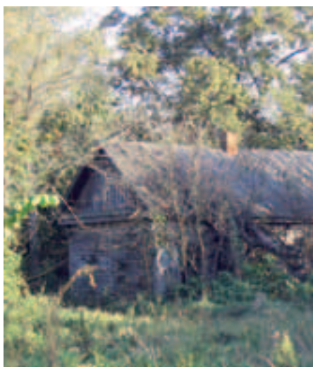
В чернобыльской запретной зоне растительность поглощает заброшенные дома.

Окончательный доклад включает в себя программу работы, предусматривающую приоритетные трансграничные проекты с акцентом на совместном подходе к регулированию водных, лесных и природных ресурсов Полесья, входящего в состав Беларуси и Украины.