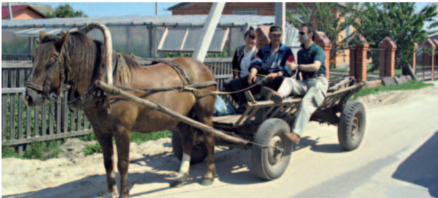
Сотрудники Офиса знакомятся с положением фермеров в восточном Полесье. Офис оказывает поддержку в осуществлении агропромышленных проектов, призванных повысить уровень жизни и обеспечить устойчивое развитие в этом по преимуществу сельскохозяйственном районе (осень).

Привлечение внимания к экологическим проблемам. В декабре 2005 года Офис принял участие в организации учебных занятий по Орхусской конвенции в Орхусском центре, который был открыт в рамках совместного проекта с участием министерства природных ресурсов и охраны окружающей среды. Сотрудники Офиса оказывали помощь в проведении просветительских кампаний и юридических консультаций по экологическим проблемам и безвозмездно передали Центру оборудование, предоставленное по линии совместного проекта.