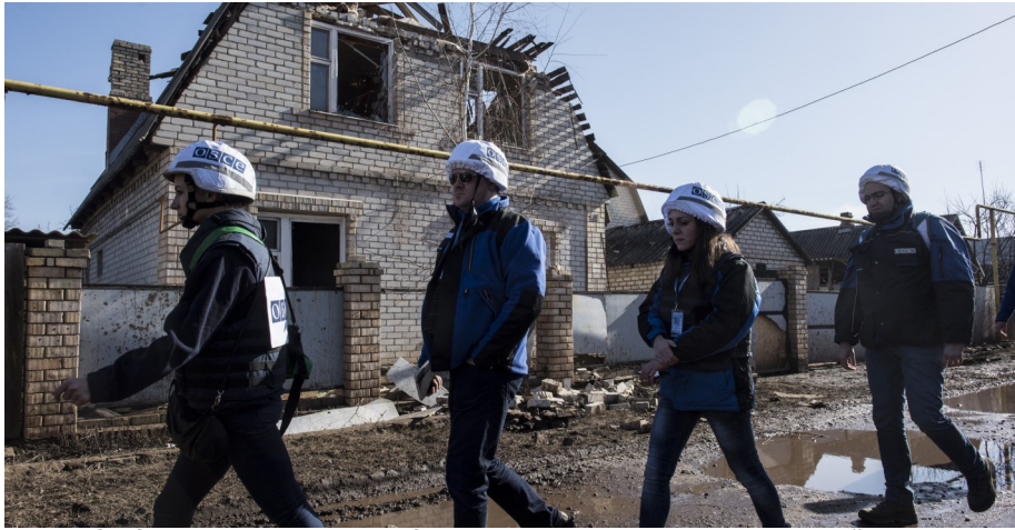
Наблюдатели СММ ОБСЕ проводят пешее патрулирование в восточной Украине.