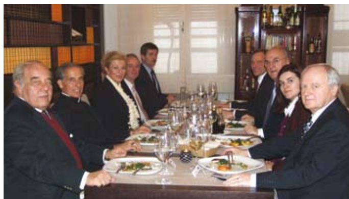
Voditelj Misije organizirao je oproštajni ručak za msg. Francisca Javiera Lozana, apostolskog nuncija u Hrvatskoj. Ministrica vanjskih poslova Kolinda Grabar-Kitarović i velika skupina veleposlanika nazočila je ručku.