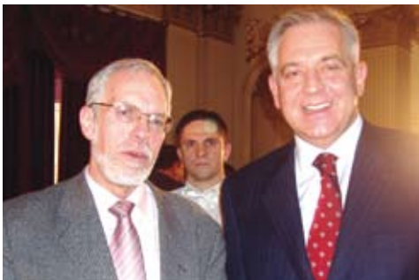
Premijer Sanader čestita veleposlaniku Beckeru

Tijekom svojih 40 godina diplomatskog iskustva, Todd je bio na mnogim uzbudljivim mjestima u ključnim trenucima. Prašina srušenog zida još je uvijek bila u zraku Berlina kada je on uspostavio prvi američki Generalni konzulat u jednoj od država bivšeg Varšavskog pakta, u Leipzigu. Kako je dvije dužnosti obnašao u Grčkoj, Todd je osobno iskusio dva državna udara 1967. godine. Dok je živio u Berlinu, terorističke prijetnje bile su toliko ozbiljne da je imao naoružane policijske čuvare koji su živjeli u njegovoj kući 24 sata na dan. A čak i na „idiličnim“ otocima Fidžija, pomogao je organizirati i voditi veliki projekt pomoći žrtvama uragana nakon što je otoke poharala jedna od najvećih oluja u posljednjih nekoliko desetljeća.