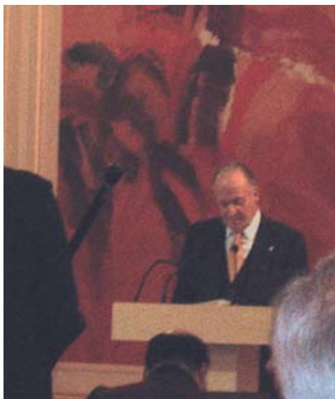
Španjolski kralj Juan Carlos I govori na otvaranju novog sjedišta Tajništva OESS-a, 21. studenog 2007.