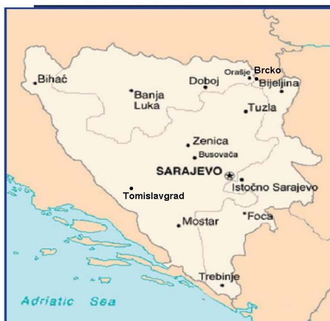
Slika 10: Pregled rasporeda zatvora u BiH