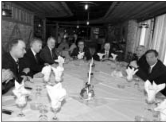
PSPP Michael Steiner në drekë pune me Kryesinë e Kuvendit, me 25 mars 2003

Ata janë duke ecur mbarë, por akoma nuk kanë arritur të bëjnë këtë. Sa më shpejt që të arrijnë këtë, aq më parë institucionet e Kosovës do të jenë me afër integritet në familjen evropiane.