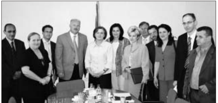
Gjatë periudhës kohore 12 - 15 maj 2003, një delegacion multipartiak dhe multietnik i Kuvendit të Kosovës, vizitoi Tiranën për të takuar kolegët e tyre nga Kuvendi i Shqipërisë.

Në takimet me Kryetarin e Parlamentit z. Servet Pëllumbin, Ministrin për Ambient, Prof. Dr. Lufter Xhuvelin, dhe Ministrin për Punë dhe Mirëqenie Sociale, znj. Valentina Leskaj, u diskutua rreth sfidave politike për implementimin e standardeve evropiane. Përmirësimi i strukturave politike dhe administrative, si dhe i punëve rutinore është parë si një proces i vazhdueshëm, i cili ka për qëllim zgjidhjen sa më adekuate