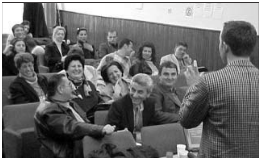
"Politikat e komunave s'duhet të paraqesin ndonjë çështje serioze - një pamje nga trajnimi mbi pakon e masave për iniciimin e aktiviteteve të Kuvendeve Komonale në Prizren" (PMIAKK)

Trajnimet e ofruar nga OSBE-ja janë udhëhequr nga trajnerët e Kosovës për kosovarët, në gjuhën e tyre amtare. Në këtë mënyrë trajnimi është pranuar më mirë dhe ka qenë më efektiv meqë është zhvilluar drejtpërdrejt në gjuhën shqipe, serbe dhe turke. Si përjashtim nga rregullat, dy kolegë nga Kombet e Bashkuara dhe Estonia i kanë përkrahur 18 trajnerët e OSBE-së. Kjo bëri të mundur dialogun dhe