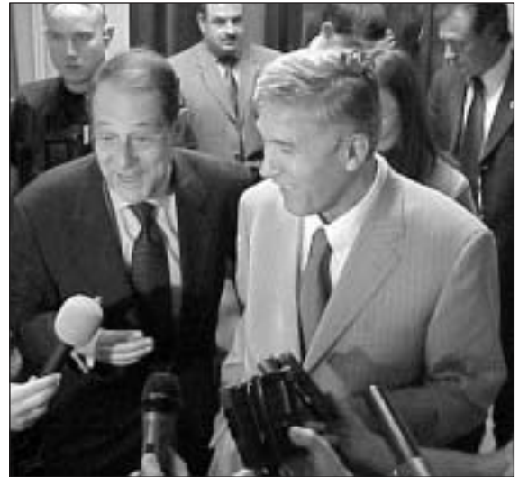
Me 5 qershor, Z. Sollana vizitoi vendet ballkanike para samitit të UE në Selanik. Me 5 qershor, Z. Sollana përfaqësues i lartë për Politikë të Jashtme dhe Siguri, u takua me profesor Dacin, Kryetarin e Kuvendit të Kosovës, para seancës plenare të Kuvendit. Z. Sollana vizitoi vendet ballkanike para samitit të UE në Selanik.

Si ballafaqoheni me këtë kritikë? Njerëzit thonë se ju po veproni si antar