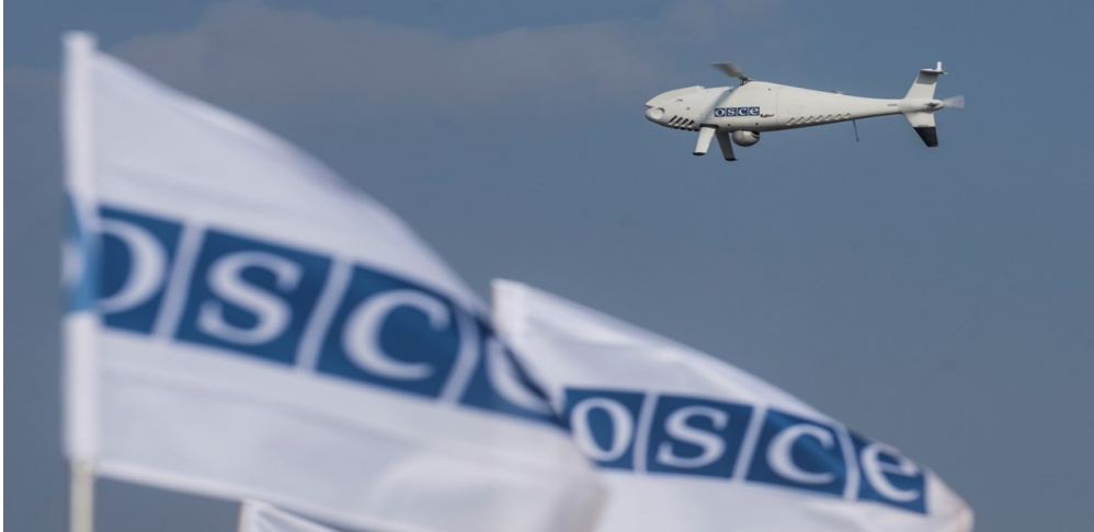
Безпілотний літальний апарат СММ дальнього радіуса дії