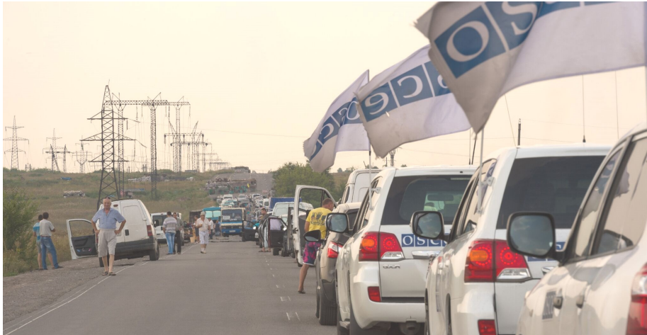
Люди в очереди на контрольном пункте въезда-выезда «Марынка», Донецкая область, 2 августа 2016.