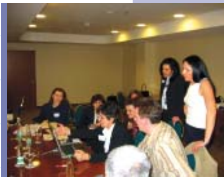
Заклучоци на првата работна група

1. Законот за територијална организација на единиците на локална самоуправа во Република Македонија го утврдува бројот на општините во Република Македонија и ги дефинира населените места што ги формираат општините.