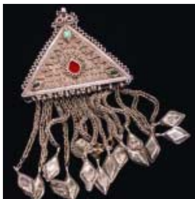
Кыргызстан, неизвестный художник. Древняя подвеска (серебро и красное стекло).