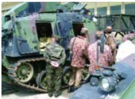
Группа узбекских специалистов осматривает легкую бронированную ремонтно-эвакуационную машину в Маутерне (Австрия).

Этот проект, осуществляемый при поддержке Центра ОБСЕ в Ташкенте, продолжится в сентябре 2004 года, когда подготовку в Германии пройдет дополнительное число узбекских специалистов по контролю над вооружениями.