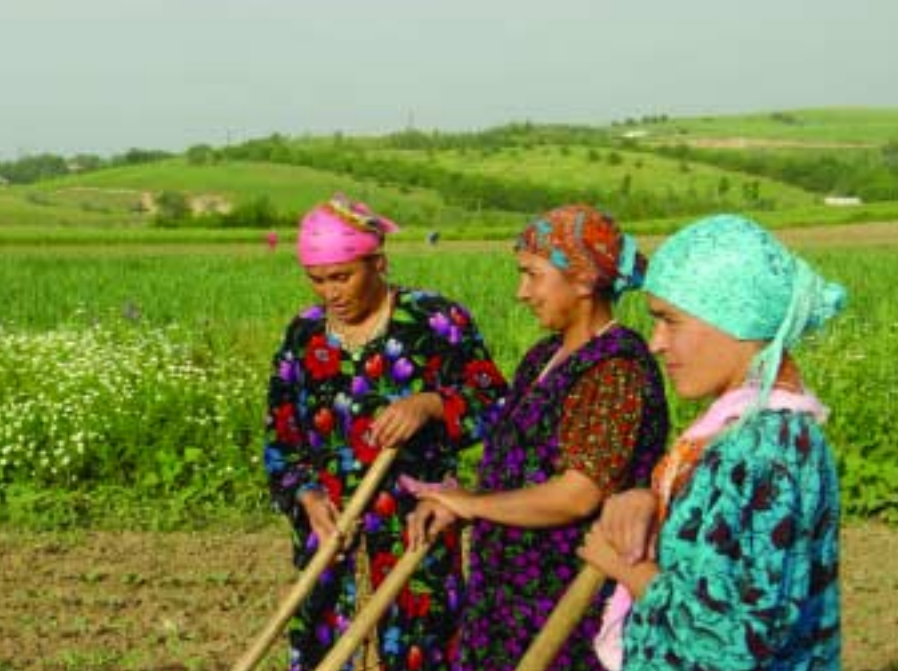
ОБСЕ/СЕРЕН В. НИССЕН