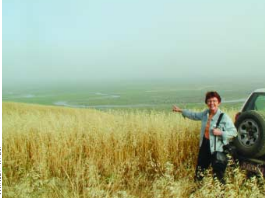
ПОСОЛ ЭВЕЛИН ПАКСЛИ

На всем протяжении поездки я постоянно задавал себе вопрос: «Какое влияние может ОБСЕ оказать на будущее этой страны, учитывая ограниченность ресурсов и недостаточную структурную развитость Организации»? Постепенно стали вырисовываться некоторые ответы, и я убедился в том, что даже далеко не грандиозная деятельность, опирающаяся на довольно скромное финансиро-