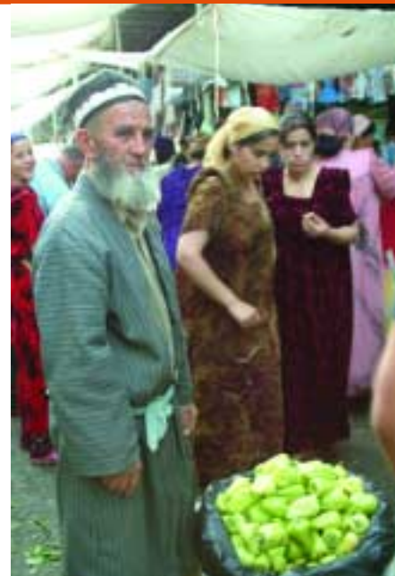
Цель земельной реформы – дать крестьянам больше свободы в диверсификации выращиваемых культур.