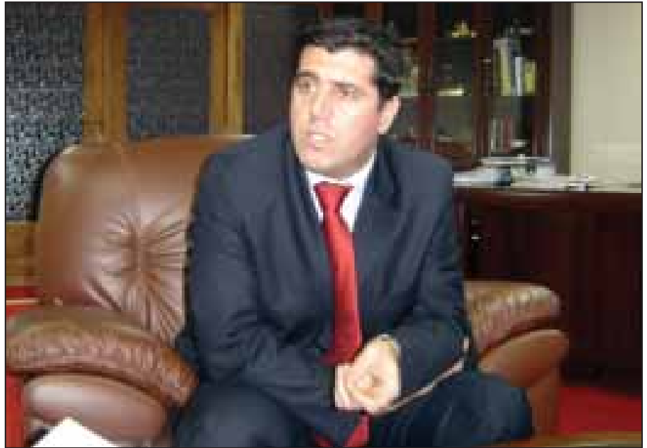
Ljutfi Haziri, ministar za lokalnu upravu

Ministar Haziri: "Ovaj proces je na Kosovu počeo ranije. Naravno, zahtevi etničkih