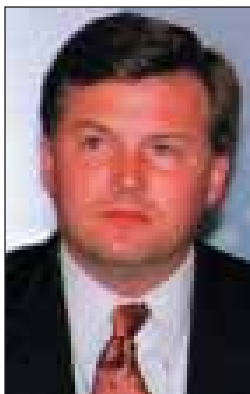
Sven Lindholm portparol Misije OEBS na Kosovu

slučajevim naziva decentralizacijom. Ovi koncepti imaju sličnu osnovu, ali su u suštini prilično različiti. Reformom lokalne uprave zajednicama se omogućuje da na bolji način rešavaju probleme od postojećih opštinskih uprava, dok decentralizacija predstavlja prenos centralnih ovlašćenja na niži nivo uprave.