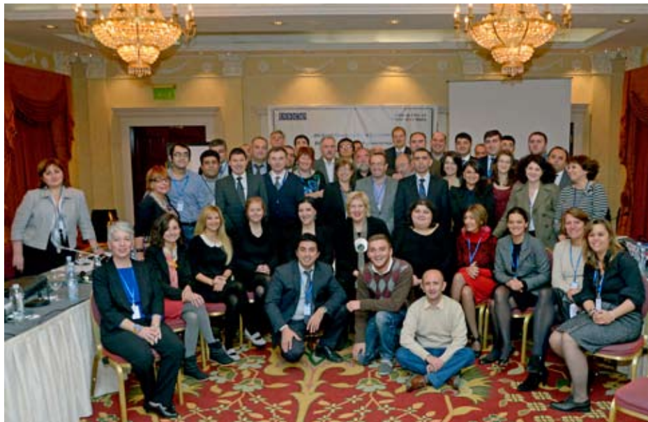
Групповая фотография всех участников конференции