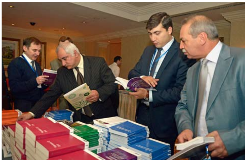
Участники конференции знакомятся с различными публикациями, изданными Бюро Представителя ОБСЕ по вопросам свободы СМИ