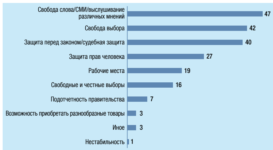
Иллюстрация 2 7 . Что означает для вас демократия? (вопр. 22)

Когда задавался прямой вопрос – существует ли свобода слова в Грузии, в обоих проведенных CRRC исследованиях СМИ за 2009 и 2011 гг. отмечалось, что респонденты были весьма пессимистичны в