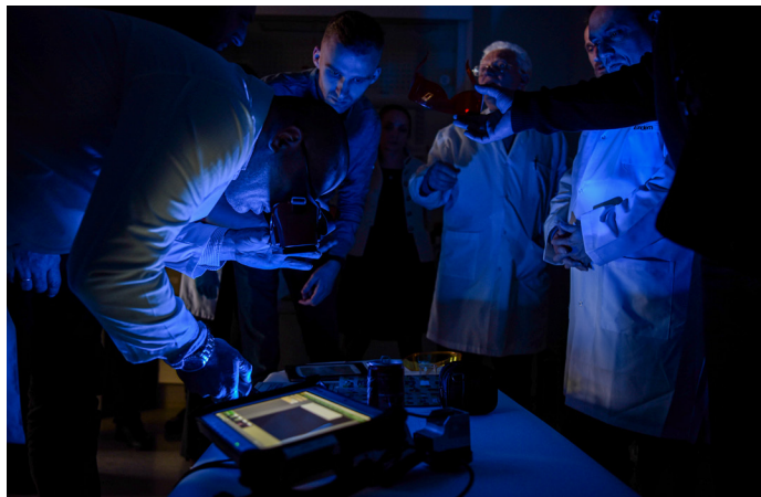
Misija pomaže Agenciji za forenziku i Forenzičkoj jedinici Kosovske policije ciljanim obukama za njihove službenike. U martu 2023. Misija je obezbedila obuku za istražitelje mesta zločina o ispitivanju dokaza otisaka prstiju.

Misija radi i sa forumima za rad policije u zajednici i za bezbednost zajednica, angažujući ih u borbi protiv nasilnog ekstremizma, protivzakonitih droga, zločina iz mržnje, trgovine ljudima i nasilja nad ženama, uključujući nasilje u porodici, na