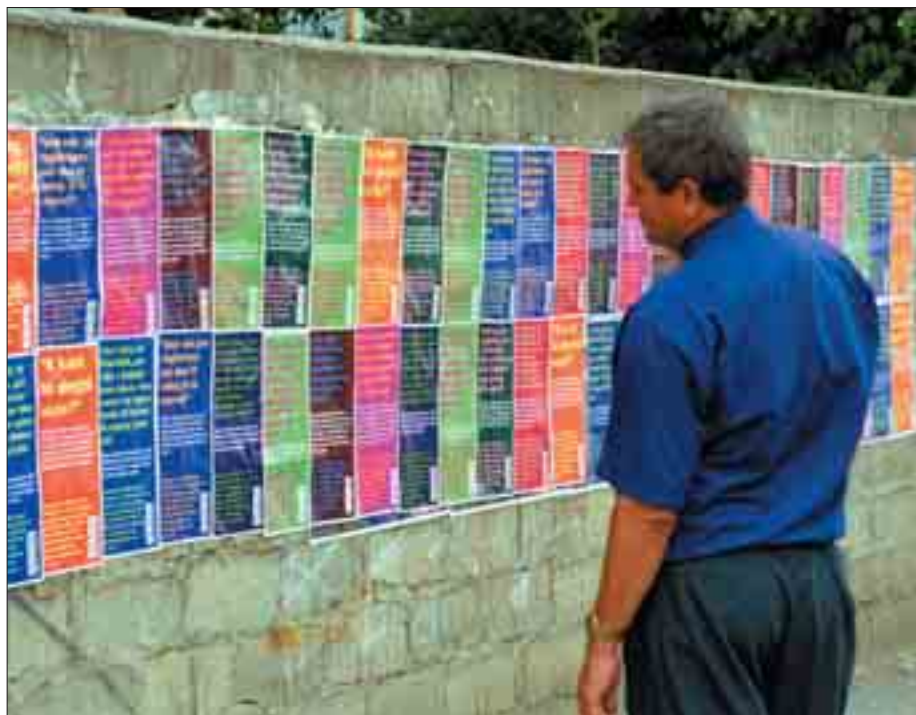
Saradnja SCIK i OEBS-a tokom skupštinskih izbora 2004, korak je ka održivom i demokratskom rukovođenju izborima na Kosovu.

Od svake registrovane političke partije se sada traži da registruje i prijavi sve doprinose koji premašuju 100 Evra. Pojedinaac ne može u toku jedne kalendarske godine dati partiji više od 20.000 Evra. Ni jedna registrovana politička partija ne sme prihvatiti indirektno doprinose preko nekog pojedinca u vidu novca, imovine ili usluga treće strane. Od političkih partija će biti zatraženo da od 1. septembra 2004. svakih šest meseci predaju detaljni finansijski izveštaj. U tom izveštaju partije su obavezne da predoče sve svoje prihode, troškove, sredstva i dugovanja.