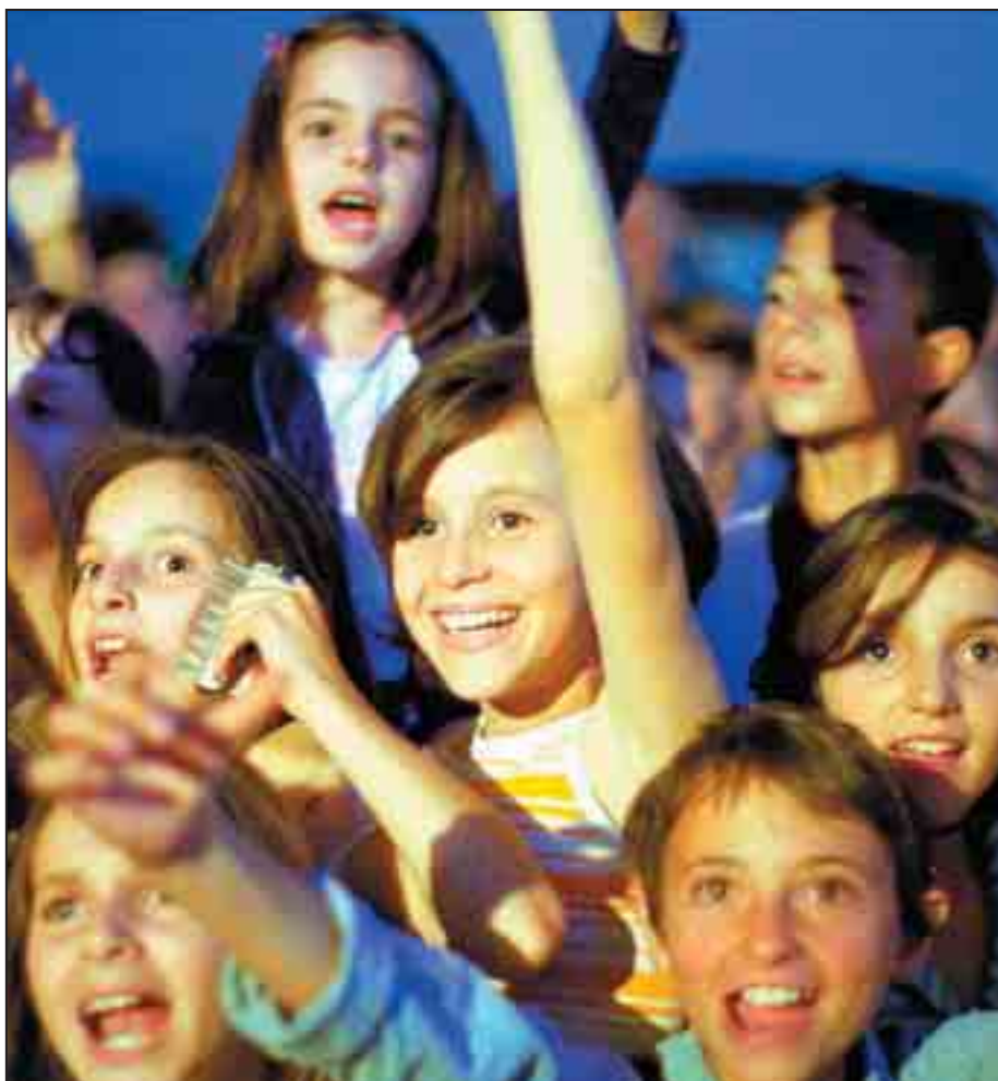
Skoro 2500 registrovanih NVO na Kosovu može igrati ključnu ulogu u procesu izgradnje demokratije.

Da zaključim, bez punog angažovanja građanskog društva, posebno kada su u pitanju teme kao što je transparentnost i odgovornost, biće teško postići standarde za Kosovo.