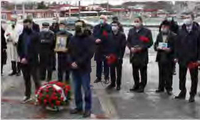
Chairman of the State Committee for Interethnic Relations of the Republic of Crimea A.Kangiev took part in a commemorative event dedicated to the death of twice Hero of the Soviet Union Amet-Khan Sultan.