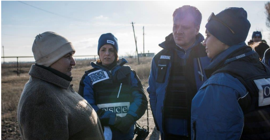
Наблюдатели СММ ОБСЕ общаются с местными жителями в восточной Украине.