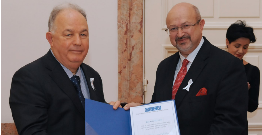
Глава СММ ОБСЕ, Эртурул Апакан (слева), получает памятную белую ленту, 1 декабря 2016 года.