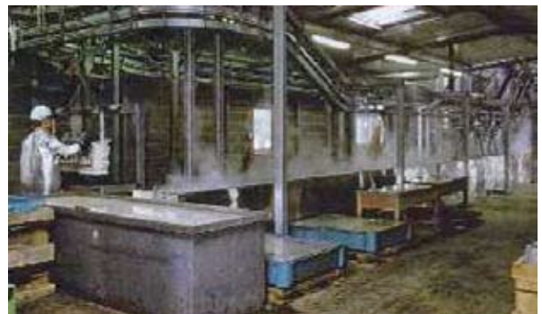
Abbildung 6.2: Rückgewinnung von weißem Phosphor durch Ausschmelzung

Die Ausschmelztechnik wird auch für die Demilitarisierung von Munition verwendet, die weißen Phosphor (WP) enthält. Diese Munition wird in einem Bad mit warmem (50° Celsius) Wasser versenkt. Der Phosphor schmilzt bei 42° Celsius und kann unter Wasser aufgefangen werden. Dieses Verfahren ist aufgrund der enormen Reaktivität von Phosphor mit dem Sauerstoff in der Luft notwendig. Der rückgewonnene WP hat Handelswert. Kleine Mengen von Kampfmitteln mit WP-Füllung können durch offene Sprengung entsorgt werden, doch sollte wegen des Umweltrisikos der Rat von Experten eingeholt werden.