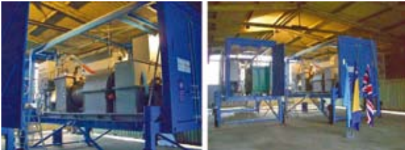
Abbildung 4.2: Das von UNDP in Bosnien eingesetzte containerisierte Munitionszerstörungssystem

In Bosnien setzt das UNDP ein containerisiertes mobiles Munitionszerstörungssystem (TADS) ein. Dieses System kann zu einem Viertel der Kosten eines vollwertigen Drehofens an jeden beliebigen Standort gebracht werden. Derartige mobile Systeme können zur Zerstörung von kleinkalibriger Munition bis zu erheblichen Mengen eingesetzt werden.