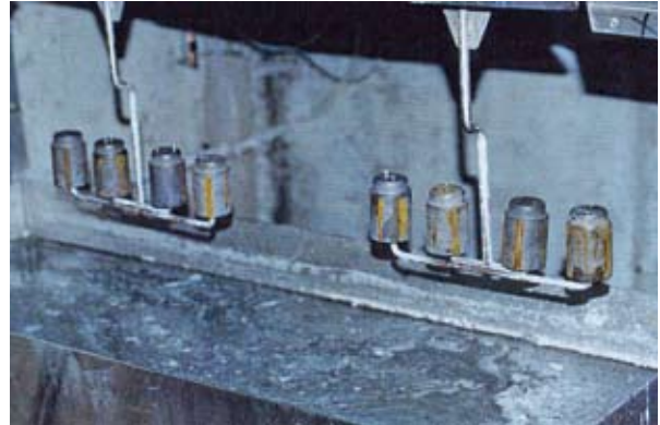
Abbildung 5.4: Eine Anlage für kryogene Zerkleinerung in Alsetex, Frankreich

Aufgrund der niedrigen Temperaturen konnte der chemische Kampfstoff in den Geschossen nicht entweichen, sodass die Metallfragmente und der chemische Stoff in einem speziellen Ofen mit Abgasreinigung behandelt wurden.