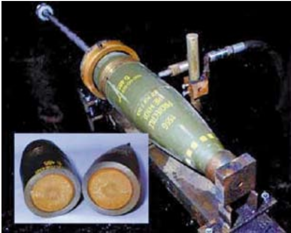
Abbildung 5.3: Ausrüstung für Abrasiv-Wasserstrahlschneiden; das kleine Foto zeigt die 155 mm großen zerschnittenen Teile.

Abschließend wird festgestellt, dass das mechanische Zerkleinern ein geeignetes Verfahren darstellt, wenn es ferngesteuert durchgeführt wird.