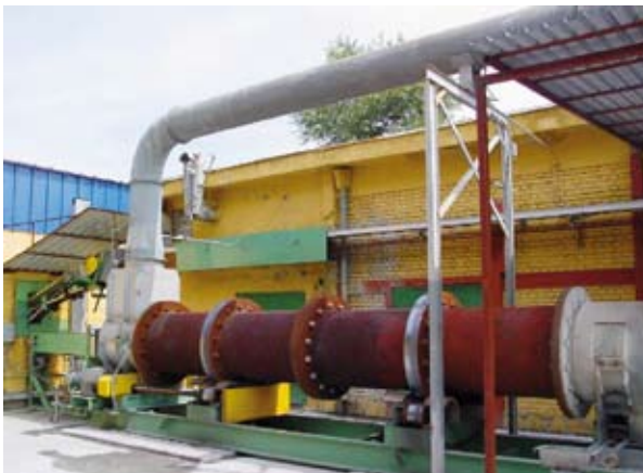
Abbildung 4.1: Außenansicht eines Drehofens

Der am häufigsten für die Zerstörung von Munition verwendete Verbrennungs-ofen ist der Drehofen.