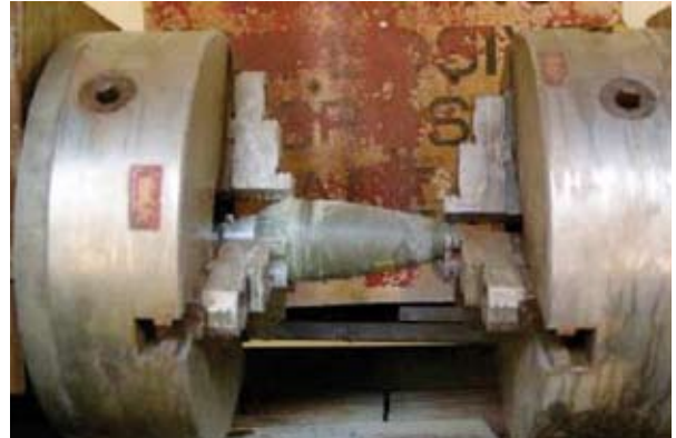
Abbildung 5.2: Drehmaschine für das Aufschneiden eines 81-mm-Mörsers