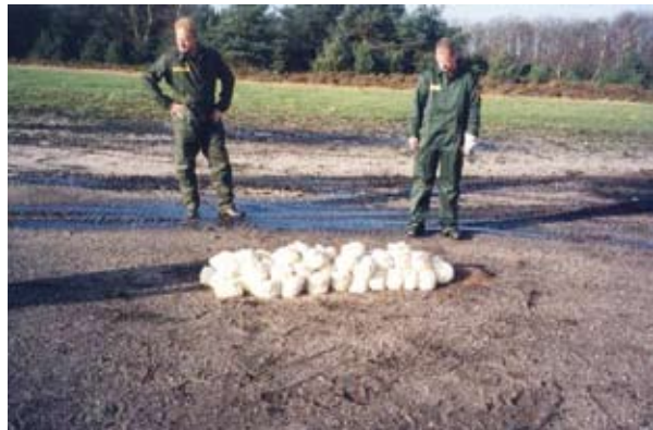
Abbildung 3.2: Zum Abbrand im Freien vorbereitete Säcke mit Treibstoffen

Der Abbrand im Freien wird in der Regel auf eigens hergestellten Strukturen wie Betonplatten oder in Metallwannen vorgenommen, um den Kontakt mit dem Boden sowie das Versickern in das Grundwasser zu verhindern. Offene Verbrennungswannen sollten aus einem Material gefertigt werden, das dem Verbrennungsprozess standhält, und sollten groß und tief genug sein, um die Rückstände der Behandlung aufzunehmen. Die Wannen können leicht erhöht aufgestellt werden, um eine bessere Kühlung sowie Inspektionen auf undichte Stellen zu ermöglichen. Die Wannen sollten abgedeckt werden, wenn sie nicht in Gebrauch sind [8].