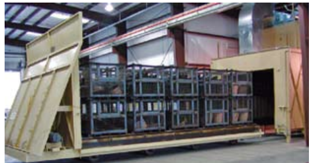
Abbildung 4.5: Heißgas-Dekontaminierungsanlage Der auf Schienen laufende Wagen wird mit Metallkörben beladen, die ihrerseits mit vorbehandelter Munition gefüllt sind.

setzen, in dem die Gegenstände als frei von erheblichen Mengen an energetischem Material gelten können (Kapitel V). Die zu behandelnden Gegenstände werden in Körbe geladen, an Metallpaletten gebunden oder direkt an der Oberfläche eines speziell konstruierten Schienenwagens befestigt. Dieser Wagen wird dann in eine Dekontaminierungskammer geschoben, in der er mit der Kammer eine absolut dichte Einheit bildet. Es wird Heißluft zugeführt, die die Kammer für 1-2 Stunden auf einer konstanten Temperatur von 300° Celsius hält.