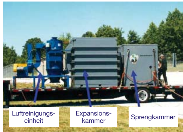
Abbildung 4.6: Mobile Version einer Sprengkammer mit Erweiterung und Luftreinigungseinheit

Um die Kontaminierung des Personals zu verhindern, müssen einfache Schutzvorkehrungen wie jene für den Abbrand und die Sprengung im Freien eingehalten werden.