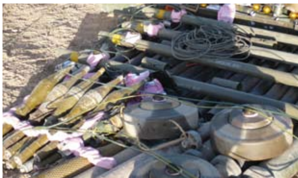
Abbildung 3.1: Zur Zerstörung ausgelegte Artilleriegranaten und Panzerabwehrminen

Bei der Sprengung im Freien wird die Munition aufgestapelt und durch gekoppelte Detonation unter Verwendung von Hohlladungen gebrauchsfähiger Explosivstoffe zerstört. Das wird durch die Explosion von Sprengladungen in engem Kontakt mit der dicht an dicht gestapelten Munition erreicht. Diese Methode ist daher nur für Munition mit einem relativ hohen Explosivstoff/Gewicht-Verhältnis geeignet.