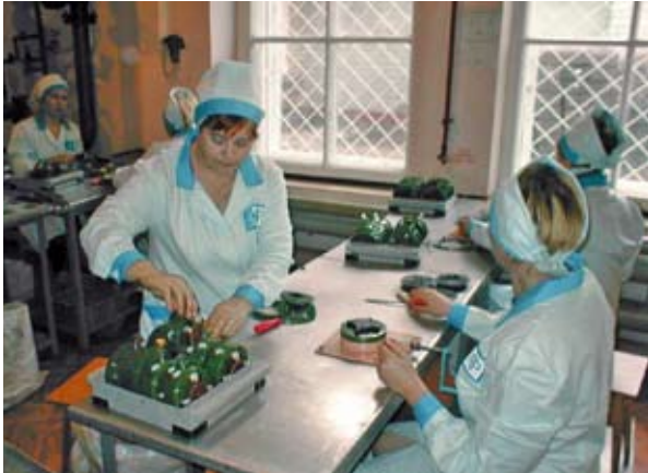
Abbildung 5.1: Manuelle Zerlegung von Antipersonenminen (Donezk, Ukraine)