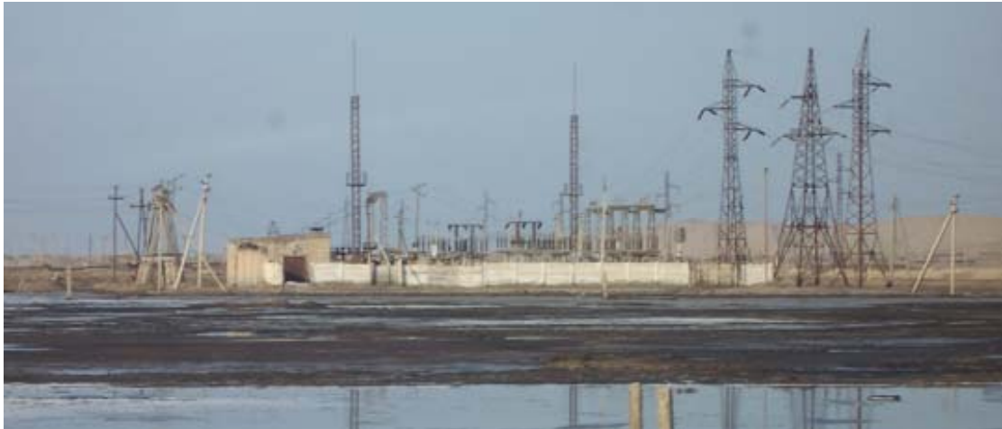
Челекенский полуостров, Туркменистан

С учетом первоначального анализа связей окружающей среды и безопасностью в Центральной Азии и на основании проявленного в регионе интереса партнеры инициативы ENVSEC начали разработку программы для Восточного Прикаспия (Атырауская и Мангистауская области Казахстана и Балканский велаят Туркменистана). Основной задачей является выявление на восточном берегу Каспийского моря и углубленный анализ проблем отдельных территорий с точки зрения окружающей среды и безопасности; организация международного консультативного процесса для определения приоритетов по вопросам окружающей среды и безопасности; и разработка программы работ с предложением конкретных мер на организационном, правовом и общественном уровнях для решения части выявленных проблем.