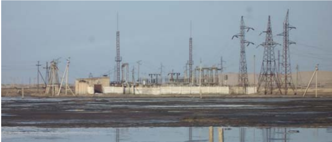
Cheleken Peninsula, Turkmenistan

As a follow-up of the initial assessment of environment and security links and impact in Central Asia and specific requests from the sub-region, the ENVSEC consortium has initiated a programme focusing on the Eastern Caspian region covering the Atyrau and Aktau oblasts of Kazakhstan and Balkan Velayat of Turkmenistan. Main aim of the project is to identify and assess in-depth environment and security hotspots on the Eastern Caspian coast, to organize international consultations to prioritize the environment and security issues and develop a programme of work proposing concrete actions on the ground on the institutional, policy and community levels to address the problems.